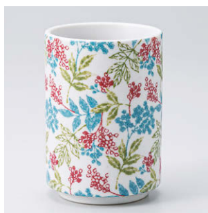
347-102-203 1,100円 ハーベスト(ブルー)寿司 (7.2×10.5・290cc)