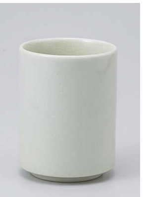
348-405-563 450円 黄地眞入2.5寿司湯呑 (7.8×10.4・330cc)