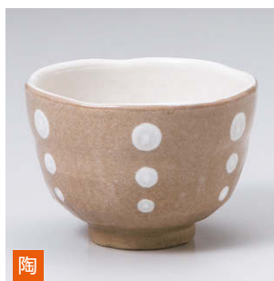
陶 351-102-743 1,400円 マーブル陶碗(茶) (9.7×6.8・280cc)