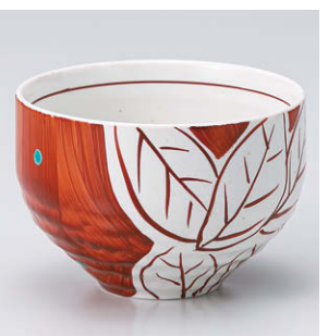
351-305-153 1,200円 手描赤絵いっぶく碗 赤ダミ木の葉 (10×7.340cc)