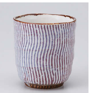
347-204-613 1,050円 まがり十草寿司湯呑赤 (8.4×9・340cc)