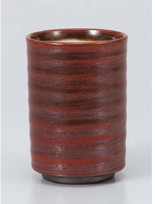
348-302-573 720円 鉄赤切立六兵寿司 (7×10・240cc)