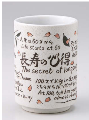
349-202-153 980円 長寿の心得中寿司 (7.2×10.2-270cc)