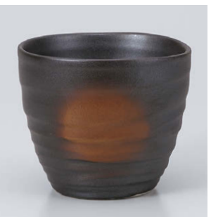
351-504-783 650円 黒備前一服碗 (9×7.8・300cc)