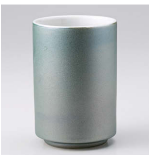
347-103-263 1,200円 ラスターグリーン大湯呑 (7×10.2・270cc)