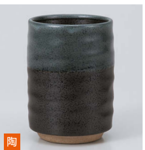
347-304-543 1,000円 黒水晶 寿司湯呑 (7.7×10.8・400cc)