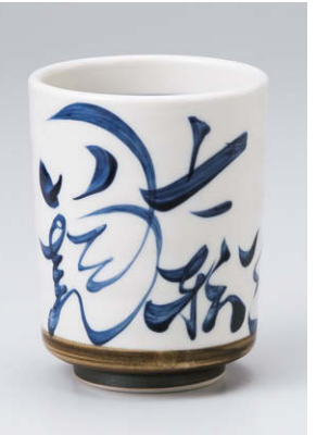
348-105-573 940円 ゴスダルマ六兵寿司湯呑 (7.9×10.1・290cc)