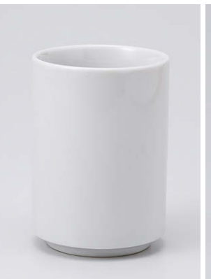
348-404-563 430円 白2.4寿司湯呑 (7.4×10.4・300cc)