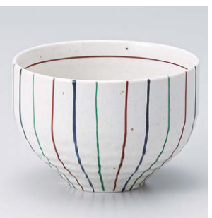
351-304-153 1,200円 手描赤絵いっぶく碗 色十草 (10×7.340cc)