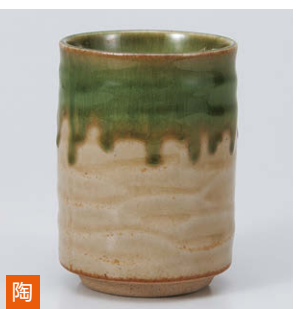
347-305-153 1,000円 波ソギ寿司織部流し (7.7×10.8・400cc)