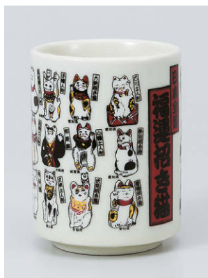
349-402-563 970円 福運招き猫寿司湯呑 (7.5×10.3-330cc)