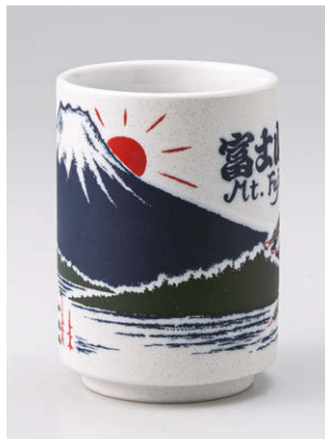
349-102-163 980円 青富士寿司湯呑 (7.2×10.2-270cc)