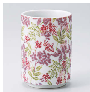
347-101-203 1,100円 ハーベスト(ピンク)寿司 (7.2×10.5・290cc)