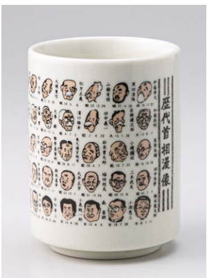
349-305-563 950円 歴代漫像首相 貫入寿司 (7.8×10.4-330cc)