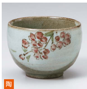
陶 351-302-203 980円 紅花ゆったり碗 (10×7.2・330cc)