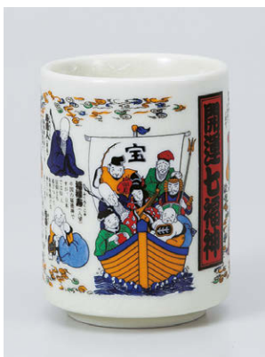
349-403-563 970円 開運七福神寿司湯呑 (7.5×10.3-330cc)