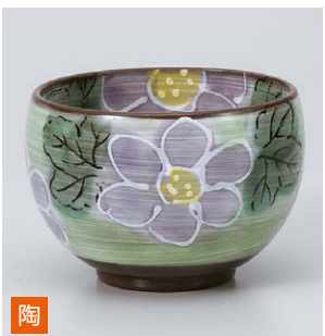
陶 351-503-573 880円 マーガレットゆったり碗紫 (9×6.8・260cc)