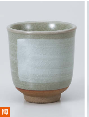
348-204-153 760円 眞入白刷毛寿司 (8.6×9.7・270cc)