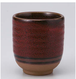
347-303-163 1,170円 赤柚木寿司湯呑 (8.3×9.2・300cc)