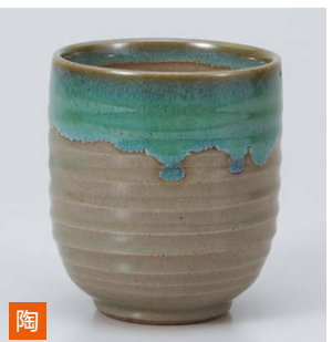
347-504-473 1,000円 均窯寿司湯呑 (7.8×9.8・330cc)