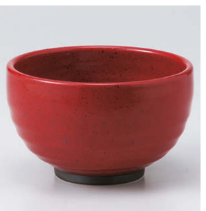
351-405-253 1,000円 赤柚子4.0多用井 (12.5×7.5・400cc)