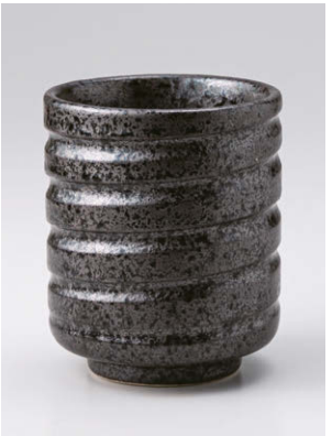
348-202-153 800円 螺旋彫寿司湯呑 黒吹 (8.3×9.7・330cc)