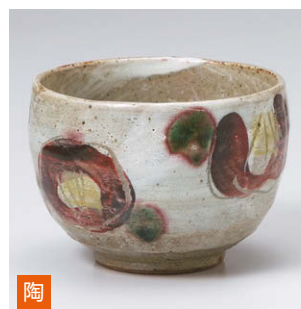
陶 351-301-203 980円 彫山茶花ゆったり碗 (10×7.2・330cc)