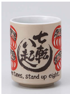
349-302-513 980円 七転八起寿司 (7.2×9.2-260cc)