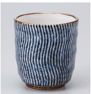
347-203-613 1,050円 まがり十草寿司湯呑青 (8.4×9・340cc)