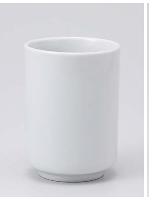
348-403-563 420円 寿司湯呑 小 (7.3×10.1・270cc)