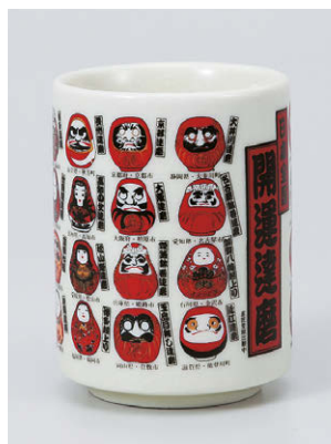
349-401-563 970円 開運達磨寿司湯呑 (7.5×10.3-330cc)