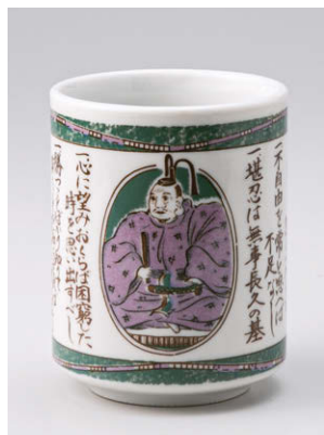
349-301-163 860円 人生訓寿司湯呑 (7.3×9.2-280cc)