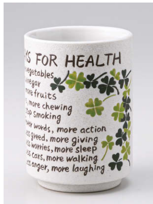
349-201-153 980円 健康十訓寿司 (7.2×10.2-270cc)