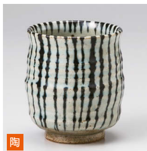
347-402-573 980円 ゴス十草寿司湯呑 (8×9.3・350cc)