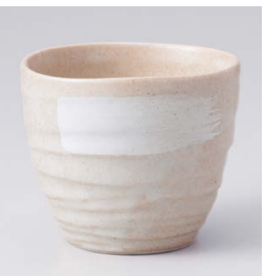
351-505-783 650円 黄志野一服碗 (9×7.8・300cc)