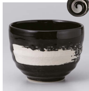
351-401-743 1,000円 刷毛目一福碗(黒) (9.7×7.5・340cc)