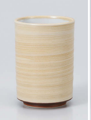
348-303-573 720円 刷毛目切立六兵寿司 (7×10・240cc)