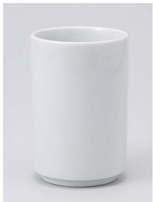
348-401-513 410円 白2.4寿司 (7.7×11.4・380cc)