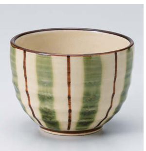
351-404-743 980円 織部十草ゆったり碗 (9.8×7.5・340cc)