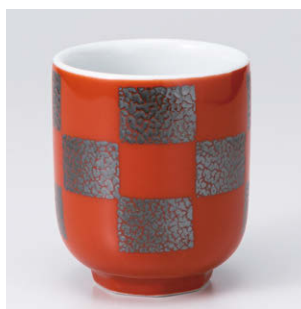
347-302-573 1,250円 朱赤市松寿司湯呑 (7.5×9・250cc)