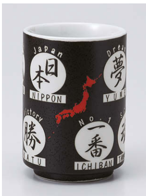
349-304-513 980円 侍日本白寿司 (7.2×10.2-290cc)