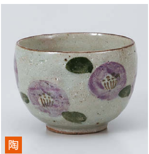
陶 351-203-513 1,000円 いっぶく碗紫椿 (9.8×7.2・360cc)