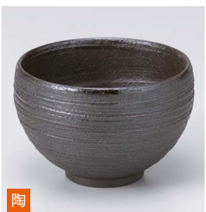
陶 351-103-053 1,350円 うるし黒たっぶり碗 (10×6.5・300cc)