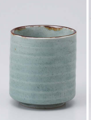
348-304-153 600円 洪草寿司湯呑 (7.8×8.5・250cc)