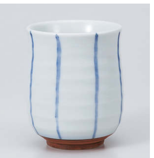
347-505-203 950円 青磁トクサ中寿司 (7.5×9.6・280cc)