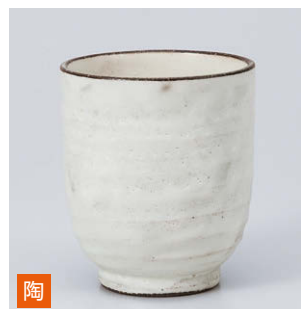
347-201-543 1,100円 白粉引寿司湯呑 (8×9・280cc)