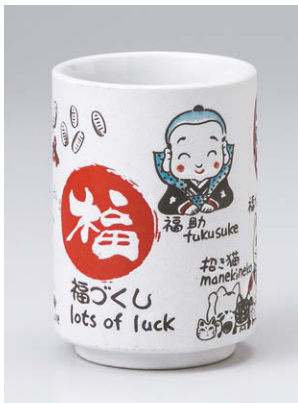
349-103-153 980円 福づくし中寿司湯呑 (7.2×10.1-270cc)