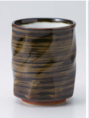
348-103-163 900円 天目刷毛目八角寿司湯呑 (8.2×10・340cc)