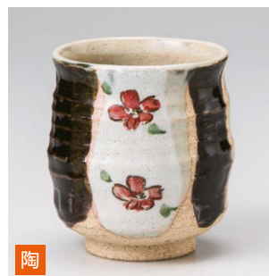
347-401-573 980円 間取花寿司湯呑 (8×9.3・350cc)