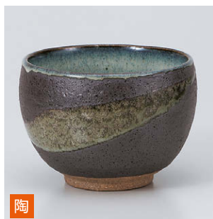
陶 351-202-513 1,000円 いっぶく碗黒銀彩雲 (9.8×7.2・360cc)