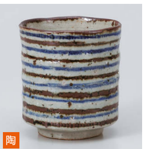
347-405-573 970円 紺筋角寿司 (8.5×9.5・330cc)