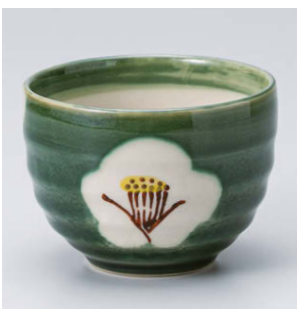
351-403-743 980円 織部椿ゆったり碗 (9.8×7.5・340cc)