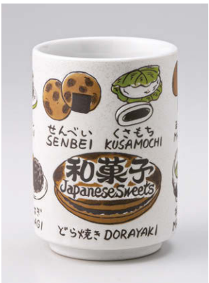
349-105-153 980円 和菓子 中寿司 (7.2×10.2-270cc)