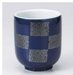
347-301-573 1,250円 ルリ市松寿司湯呑 (7.5×9・250cc)