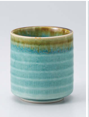
348-203-783 680円 ヒスイ 寿司湯呑 (7.8×8.3・250cc)