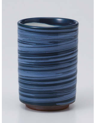
348-301-153 720円 切立六兵衛中寿司 紺刷毛目 (7×10・230cc)