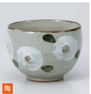
陶 351-204-513 1,000円 いっぶく碗白椿 (9.8×7.2・360cc)