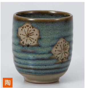
347-503-473 1,000円 梅ちらし寿司湯呑 (7.8×9.8・330cc)