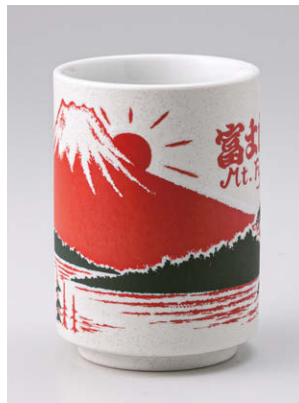
349-101-163 980円 赤富士寿司湯呑 (7.2×10.2-270cc)