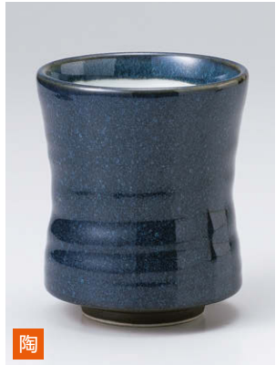
348-101-513 1,350円 ナマコキネ中寿司 (8.5×10・320cc)