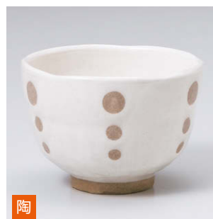
陶 351-101-743 1,400円 マーブル陶碗(白) (9.7×6.8・280cc)