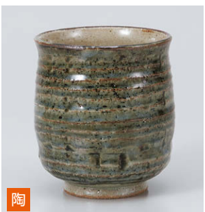
347-403-573 980円 窯変寿司 (8×9.3・330cc)