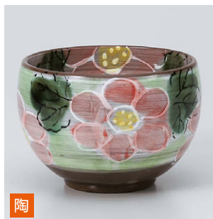
陶 351-502-573 880円 マーガレットゆったり碗オレンジ (9×6.8・260cc)