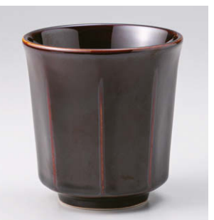
347-205-513 1,000円 アメ 8角反寿司 (8.8×9.2・300cc)