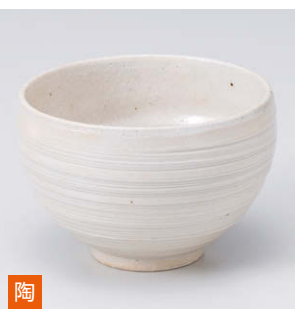
陶 351-104-053 1,350円 うるし白たっぶり碗 (10×6.5・300cc)