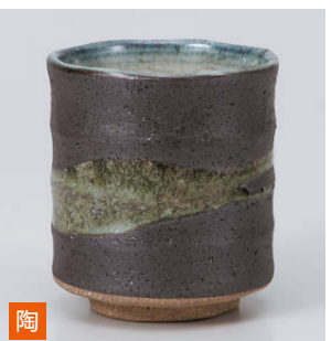
347-404-573 970円 黒銀彩角寿司 (8.5×9.2・330cc)