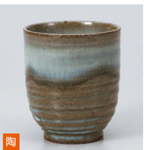
347-105-543 1,100円 うす萩寿司湯呑 (8×9・280cc)