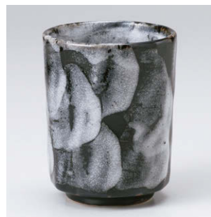
347-501-573 1,100円 黒志野ダイヤ寿司湯呑 (8×10.2・280cc)