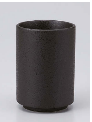
348-402-563 550円 黒吹2.4寿司湯呑 (7.2×10.4・300cc)