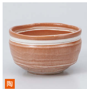
陶 351-201-573 1,400円 あけぼのいっぶく碗 (9.7×5.7・230cc)