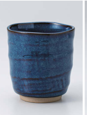
348-104-573 800円 生子寿司湯呑 (8.5×9.3・320cc)