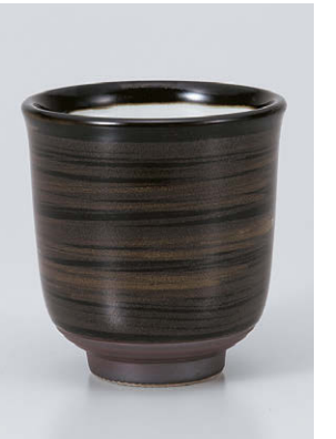
348-205-573 760円 天目刷毛目寿司 (8.5×9・260cc)