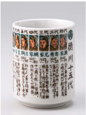
349-205-163 860円 徳川十五代寿司湯呑 (7.3×9.2-280cc)