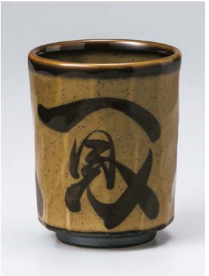
348-102-573 940円 金茶流しダイヤ寿司湯呑 (8×10.2・280cc)