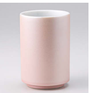
347-104-263 1,200円 ラスターピンク大湯呑 (7×10.2・270cc)