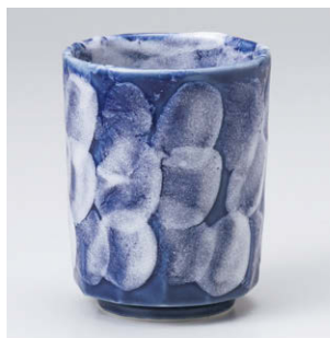
347-502-573 1,100円 青志野ダイヤ寿司湯呑 (8×10.2・280cc)