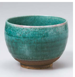
351-205-203 980円 エメラルドゆったり碗 (10×7.2・330cc)