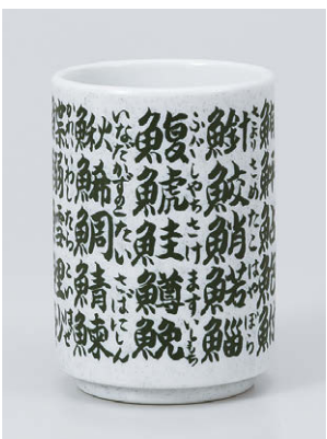
349-405-573 650円 梨地魚文字寿司 (7×10-290cc)