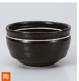
陶 351-105-573 1,400円 ゆず黒いっぶく碗 (9.7×5.7・230cc)