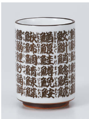
349-404-523 820円 魚文字寿司湯呑 (7.1×10.3-270cc)