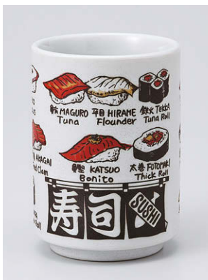
349-303-513 980円 すしねた寿司 (7.2×10.2-290cc)