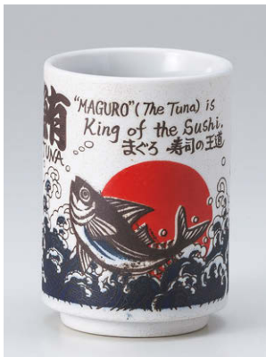
349-203-153 980円 まぐろ中寿司湯呑 (7.2×10.1-270cc)