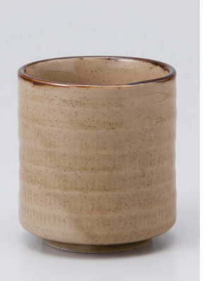
348-305-153 600円 益子風寿司湯呑 (7.8×8.5・250cc)