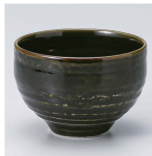
351-501-523 850円 織部陶碗 (10×7・330cc)