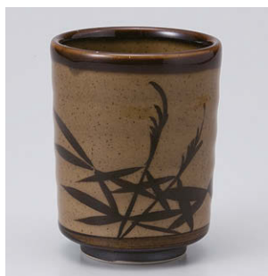
347-202-513 1,050円 金茶笹六兵寿司 (7.9×10・300cc)