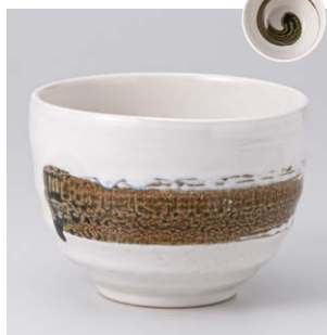
351-402-743 1,000円 刷毛目一福碗(白) (9.7×7.5・340cc)