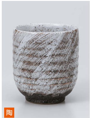
348-201-573 950円 さざ波寿司 (7.8×9.5・300cc)