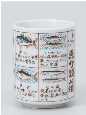
349-204-563 880円 魚介類10種寿司湯呑 (7.3×9.3-250cc)