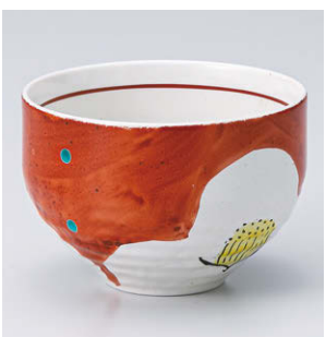
351-303-153 1,200円 手描赤絵いっぶく碗 赤ダミ椿 (10×7.340cc)