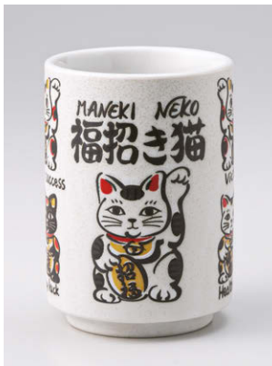
349-104-153 980円 福招き猫 中寿司 (7.2×10.2-270cc)