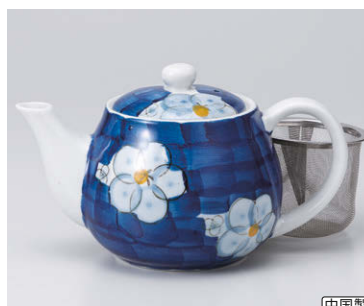
344-503-203 2,300円 ダミ間取花 軽量ポット (17×10×10.5・450cc)