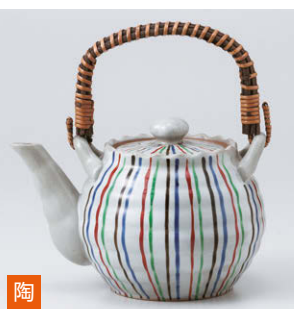
陶 339-103-513 5,200円 十草6号土瓶 (19×12.5×1000cc)