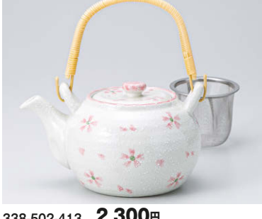
338-502-413 2,300円 さくら淡雪 4号土瓶 (12.5×10-720cc)