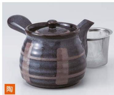
342-103-513 2,700円 嵐志野六兵急須 (11×10.5・500cc)