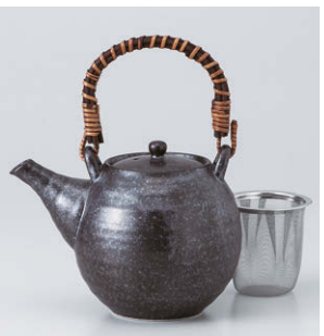
339-403-523 5,100円 銀黒土瓶(アミ付)大 (16×10.3×11.3×530cc)