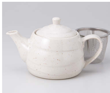
345-403-313 2,400円 白唐津 ポット急須(アミ付) (11×17.5×9.5・400cc)