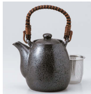
339-501-353 3,650円 黒結晶 土瓶(カゴアミ付) (9×12×400cc)