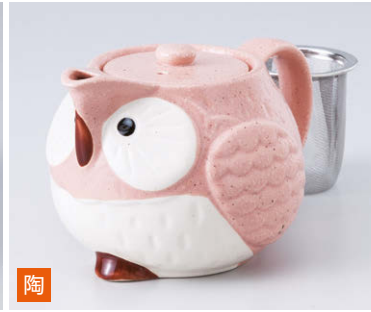
345-204-473 2,750円 ふくろうポット(ピンク)(カゴアミ付) (11×9.5・480cc)