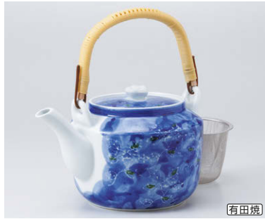
338-101-543 7,000円 濃牡丹8号土瓶(アミ付) (16×13.8-1700cc) 338-102-543 5,200円 濃牡丹6号土瓶(アミ付) (14.5×12-1050cc)