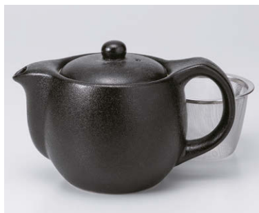
342-101-083 3,800円 黒ポット (11×10.7・500cc)