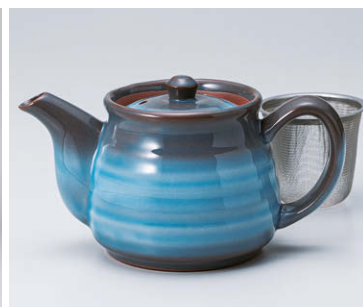
344-404-513 2,700円 ブルーハーフ六兵ポット (11×10.5・500cc)