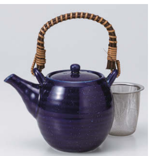
339-203-523 5,100円 夜空 土瓶(アミ付)大 (16×10.3×11.3×530cc) 339-204-523 5,000円 夜空 土瓶(小) (13.5×19.4×10.1×350cc)