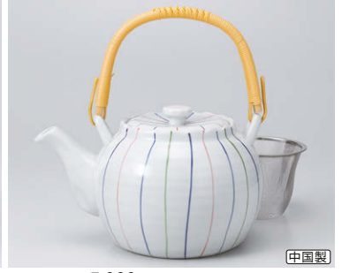
338-207-413 5,000円 三色ライン8号土瓶(21×12-1500cc) 338-208-413 4,000円 三色ライン6号土瓶(19.5×11-1070cc) 338-209-413 2,300円 三色ライン4号土瓶(17.5×9-720cc)