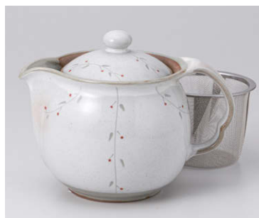
344-403-313 3,300円 白若葉ポット急須(アミ付) (9.5×15×12・550cc)