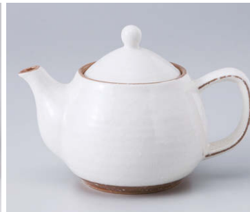
344-204-163 2,300円 白淡雪ポット急須(アミ付) (11×11・500cc)