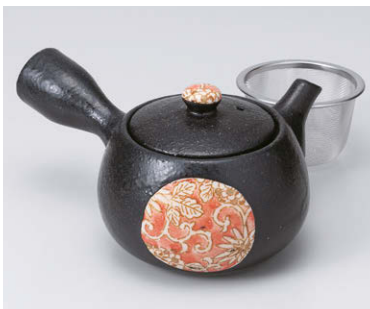
342-302-203 2,300円 天目唐草急須(アミ付) (10.5×9・350cc)