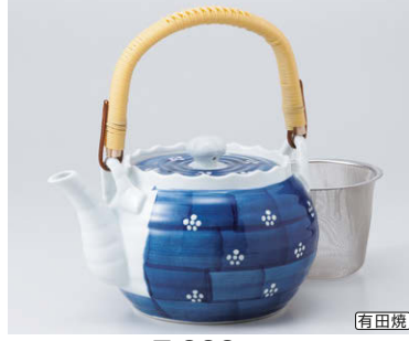
338-205-543 7,000円 梅小紋六兵衛8号土瓶(アミ付) (16×13-1500cc) 338-206-543 5,200円 梅小紋六兵衛6号土瓶(アミ付) (15×11.5-1000cc)