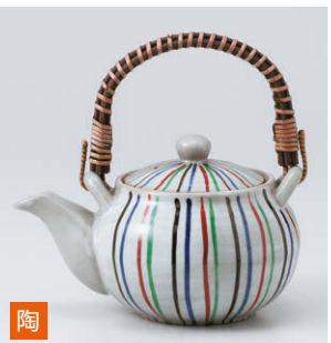
陶 339-305-513 3,400円 十草中土瓶 (16.5×10.5×600cc)