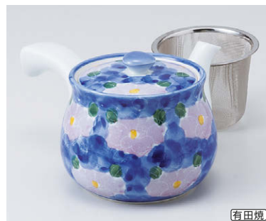
341-101-543 4,300円 紫花大急須(アミ付) (12×10・600cc)