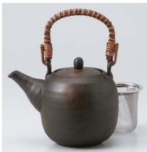
339-402-153 6,000円 備前丸土瓶(カゴアミ付) (14.3×9.8×11.5×520cc)