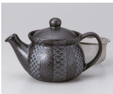
343-303-473 3,400円 銀彩(黒) すっきりポット(カゴアミ付) (10×10.5・410cc)