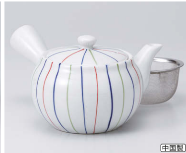
342-504-413 2,300円 三色ライン急須 (10.5×9・350cc)