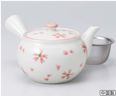
342-502-413 2,300円 さくら淡雪急須 (10.5×9・350cc)