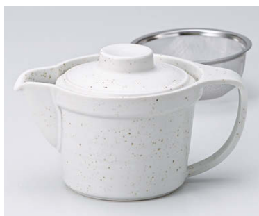
343-202-513 4,400円 白マットビターポット (11×16×9・390cc)