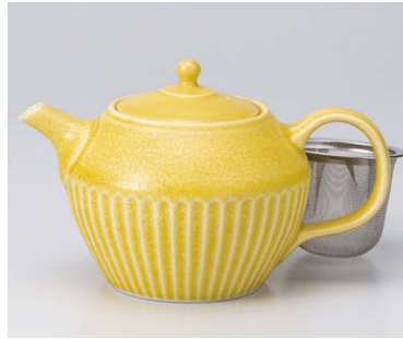
345-103-053 3,200円 削ぎ型ポット黄(網付) (16×10.5×10・380cc)