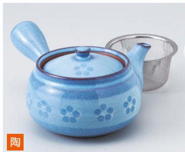
342-201-543 2,800円 均窯梅紋急須(アミ付) (11×8.5・450cc)