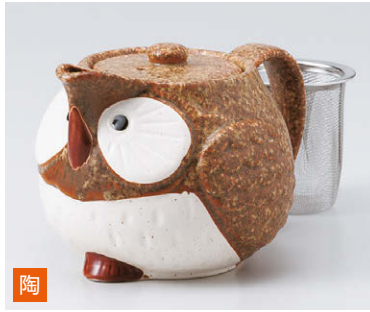
345-201-473 2,750円 ふくろうポット(茶)カゴアミ付 (11×9.5・480cc)