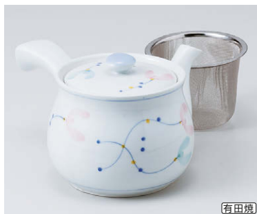
341-102-543 4,300円 スイトピー大急須(アミ付) (12×10・600cc)