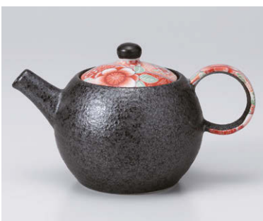
343-304-163 3,200円 紅華ミニポット (15×9・200cc)