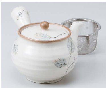
341-303-573 4,000円 山ブドウ急須 U茶こし付 (10.5×10.3・450cc)