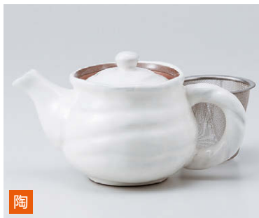
345-401-473 2,500円 白釉ひねりポット(アミ付) (10×9.5・380cc)