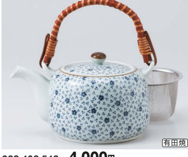
338-402-543 4,000円 風たより4号土瓶(アミ付) (12.5×9.8-700cc)