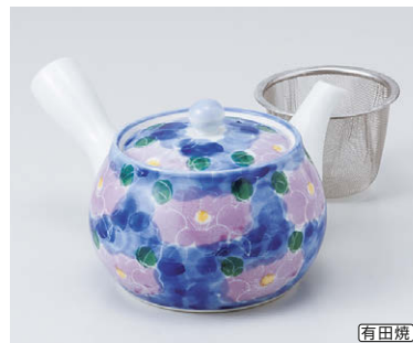
341-201-543 3,000円 紫花中急須(アミ付) (11×9・400cc)