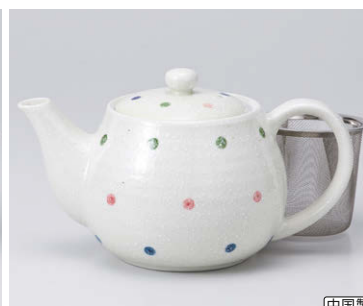
344-504-413 2,300円 水玉淡雪 軽量ポット (11×11.5・450cc)