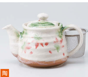
344-301-523 3,400円 織部春秋ポットUアミ付 (10.5×11・420cc)