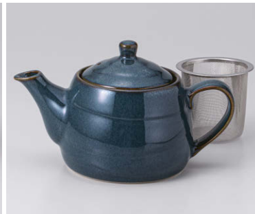
345-304-313 2,400円 ナマコ ポット急須(アミ付) (11×17.5×9.5・400cc)