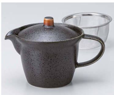
343-203-313 3,300円 黒結晶 洗い易いポット (16×10.7×11・300cc)