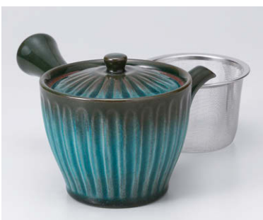
343-104-513 2,700円 深海菊型急須 (10×9.5・380cc)