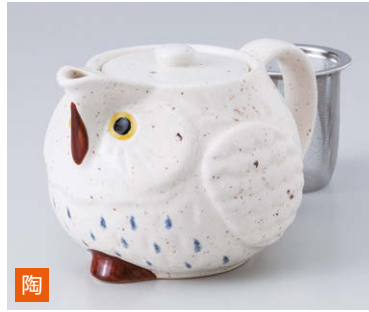
345-203-473 2,750円 ふくろうポット(白)(カゴアミ付) (11×9.5・480cc)