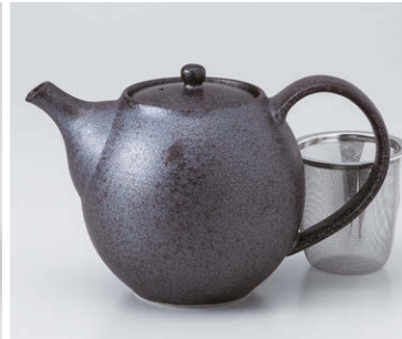
344-104-523 4,400円 銀黒ポット(アミ付) (16×10.3×11.3・530cc)