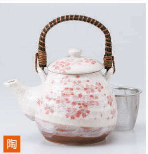
陶 339-303-523 4,800円 平安桜土瓶Uアミ付 (11.5×14×770cc)