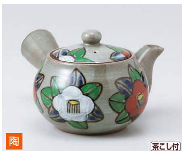
341-403-513 3,100円 椿3号急須 (10.5×9・400cc)