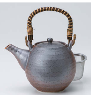
339-205-523 5,200円 黒信楽土瓶アミ付 (16×10.3×11.3×530cc)