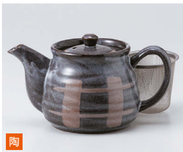
陶 343-503-543 2,700円 ねずみ格子六兵衛ポット(アミ付) (10.5×10・500cc)