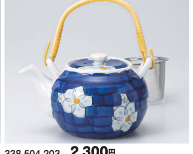
338-504-203 2,300円 ダミ間取花土瓶4.0 (17.5×9.5-720cc)