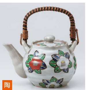
陶 339-104-513 5,200円 染錦椿6号土瓶 (19×12.5×1000cc)