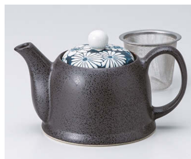
343-301-203 2,300円 花染ポット(茶こし付) (11.2×11.2・430cc)