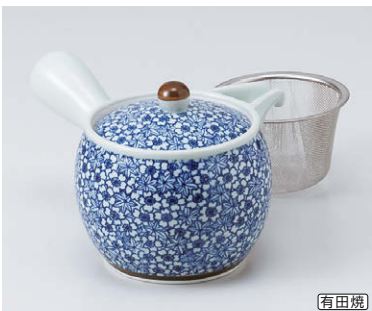
341-204-543 3,500円 桜もみじ丸型中急須(アミ付) (11×9・400cc)