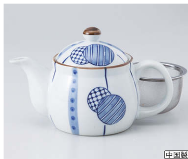
345-503-523 1,900円 藍丸紋BAポット (10.4×10.8・400cc)