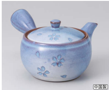
342-401-513 2,200円 白桜切立帯網急須 (10×7.5・350cc)