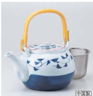
339-302-203 4,000円 ゴス巻唐草土瓶6.0 (20.5×11×1050cc)