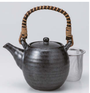
339-404-523 5,000円 漆黒 土瓶(小) (13.5×19.4×10.1×350cc)