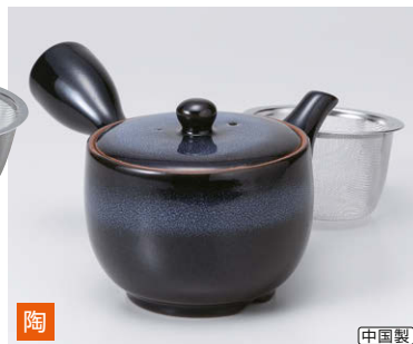
342-203-523 2,550円 オーロラ カゴ網急須 (10.5×9・320cc)