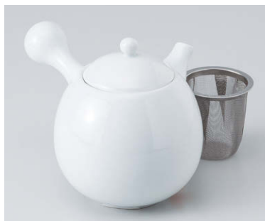
341-502-353 3,100円 白磁玉急須(茶こし付) (10.5×11.3・470cc)