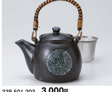
338-501-203 3,000円 唐草夏目土瓶 (11.7×13-630cc)