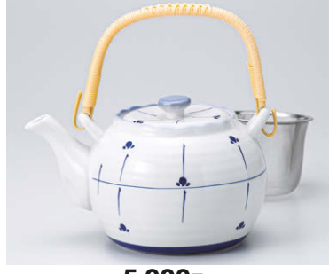
338-305-203 5,000円 めばえ土瓶8.0(21.5×13.5-1500cc) 338-306-203 4,000円 めばえ土瓶6.0(20.5×11-1070cc)