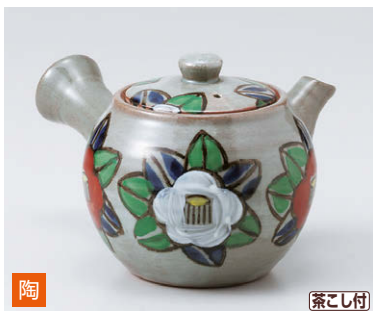
341-503-513 2,800円 錆椿 小急須 (10×10.5・400cc)