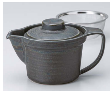
343-201-513 4,400円 シルバービターポット (11×16×9・390cc)