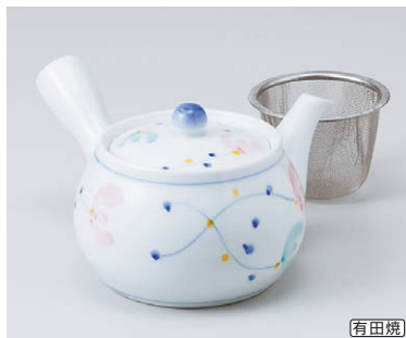
341-202-543 3,000円 スイトピー中急須(アミ付) (11×9・400cc)