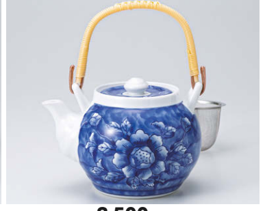
338-307-513 3,500円 ダミ牡丹6号土瓶 (18.3×13.8×12.3-1000cc)