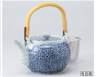
338-107-543 7,500円 桜もみじ8号土瓶(アミ付) (16×13-1500cc) 338-108-543 6,000円 桜もみじ6号土瓶(アミ付) (14×11.5-1000cc)