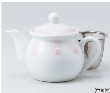
345-501-513 2,000円 染付ポット 紅梅(2179-4) (11×10.5・500cc)