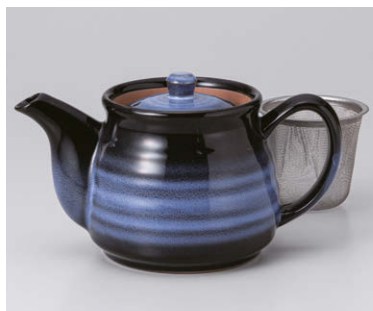
343-502-473 2,700円 オーロラ六兵衛ポット(カゴアミ付) (10.5×10・480cc)