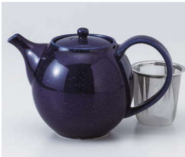
344-202-523 4,400円 夜空ポット(アミ付) (16×10.3×11.3・530cc)