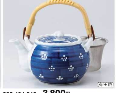
338-404-543 3,800円 梅小紋六兵衛4号土瓶(アミ付) (12×10-680cc)