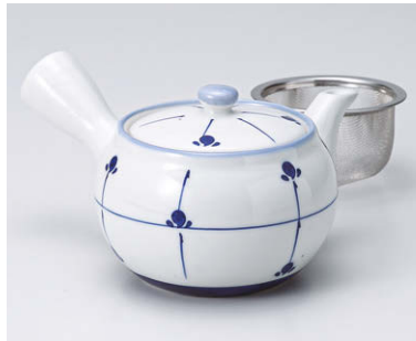
342-501-203 2,300円 めばえ急須 (10.5×9・350cc)