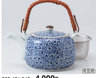
338-401-543 4,000円 桜もみじ4号土瓶(アミ付) (12.5×9.8-700cc)