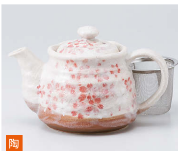
344-302-523 3,400円 平安桜ポットUアミ付 (10.5×11・420cc)