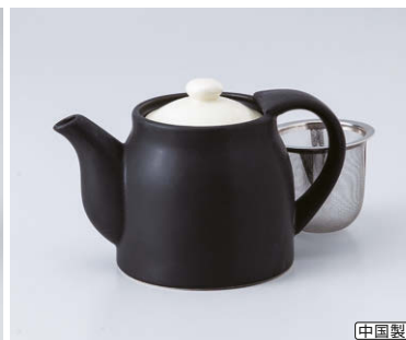
345-504-513 1,200円 蓋が落ちにくいベージュ・黒ポット (8.8×9・300cc)