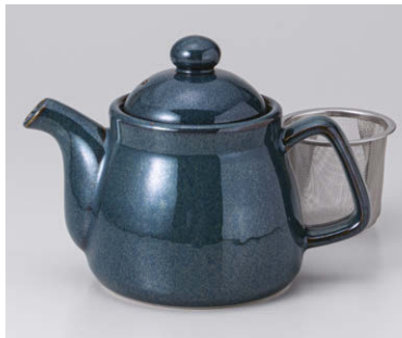
345-301-313 2,800円 ナマコ 布目ポット急須(アミ付) (11×17×12・600cc)