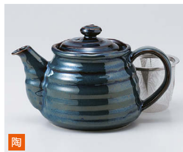
陶 343-401-523 3,000円 ナマコポット (10.5×11・420cc)