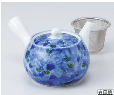
341-203-543 3,000円 濃牡丹中急須(アミ付) (11×9・400cc)