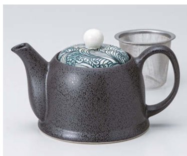
343-302-203 2,300円 荒波ポット(茶こし付) (11.2×11.2・430cc)