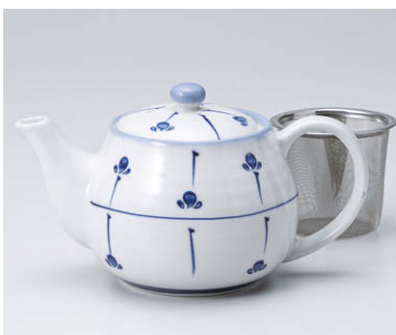
344-402-203 2,300円 めばえ軽量ポット (17×10.5・450cc)