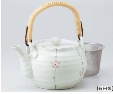
338-203-543 7,000円 梅六兵衛8号土瓶(アミ付) (16×13-1500cc) 338-204-543 5,200円 梅六兵衛6号土瓶(アミ付) (15×11.5-1000cc)