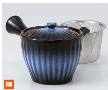
陶 343-102-473 2,700円 オーロラ菊型急須(アミ付) (10.3×10・380cc)