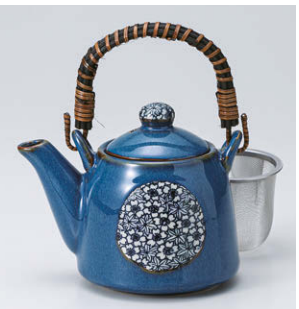
339-505-203 2,900円 スリム土瓶春秋 (10.5×12.3×480cc)