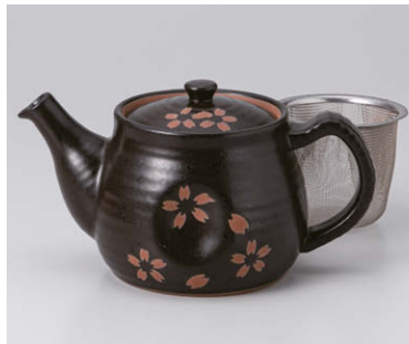
345-302-473 2,700円 破水桜ペコポット(カゴアミ付) (10×10・380cc)