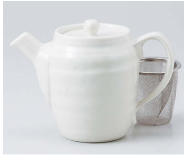
345-102-353 3,150円 セミマット ロクロ目ポット(カゴアミ付) (9×12・360cc)