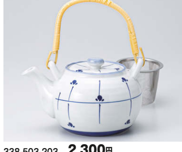
338-503-203 2,300円 めばえ土瓶4.0 (17.5×9.5-720cc)