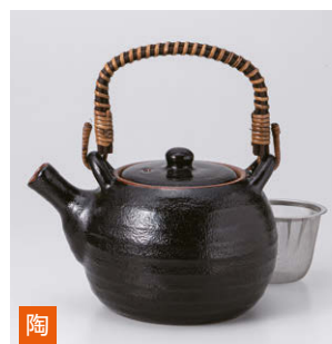
陶 339-101-543 8,500円 ゆず天目7号土瓶 (15×11.8×1250cc)