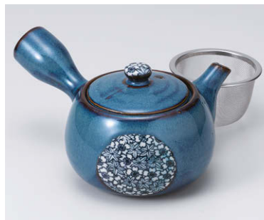
342-303-203 2,300円 ナマコ桜急須(アミ付) (10.5×9・350cc)