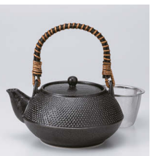
339-105-253 8,100円 あられ土瓶鉄 黒 (17.1×14.7×9.5×800cc)