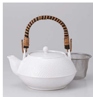
339-201-253 8,100円 あられ土瓶 白 (17.1×14.7×9.5×800cc)