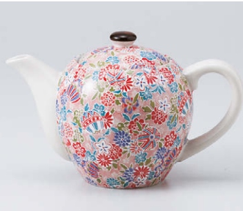
344-101-153 5,500円 京雅(赤)ポット(Uアミ付) (11×12・540cc)