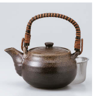
339-206-013 4,380円 金彩5号土瓶(U・茶コシ付) (19×12×750cc)