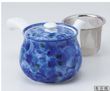
341-103-543 4,300円 濃牡丹大急須(アミ付) (12×10・600cc)