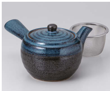
342-301-163 2,600円 黒結晶青流急須 (11×8.8・450cc)