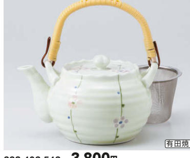
338-403-543 3,800円 梅六兵衛4号土瓶(アミ付) (12×10-680cc)