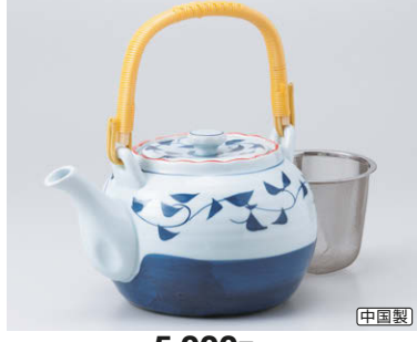
338-301-203 5,000円 ゴス巻唐草土瓶8.0(21.5×13.5-1500cc) 338-302-203 2,300円 ゴス巻唐草土瓶4.0(17.5×9.5-720cc)