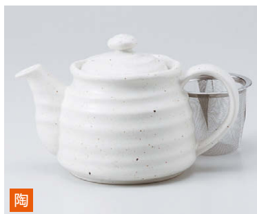
陶 343-402-523 3,000円 白釉ポット (10.5×11・420cc)