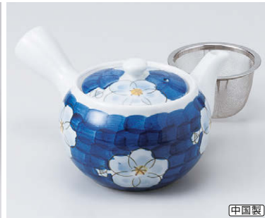
342-404-203 2,300円 ダミ間取花急須 (10.5×9・350cc)