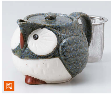
345-202-473 2,750円 ふくろうポット(青)カゴアミ付 (11×9.5・480cc)