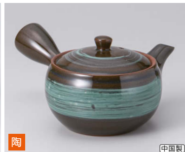
342-204-513 2,200円 切立エメラルド急須 (10×8・320cc)