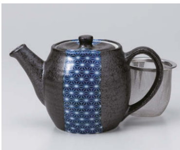
342-102-513 3,400円 色麻葉六兵ポット (9×9.5・420cc)