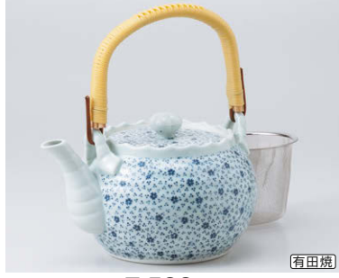
338-201-543 7,500円 風たより8号土瓶(アミ付) (16×13-1500cc) 338-202-543 6,000円 風たより6号土瓶(アミ付) (14×11.5-1000cc)