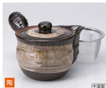
陶 343-101-523 2,700円 白ハケメ カゴ網広口急須 (11×9.5・330cc)