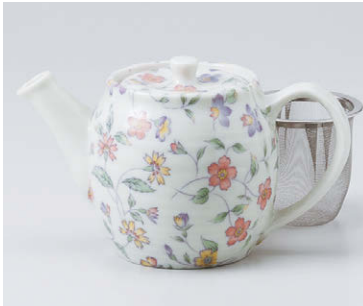
344-102-573 3,500円 すみれポット (9.5×10.3・420cc・アミ付)