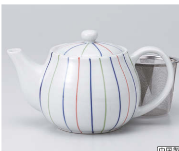
344-502-413 2,300円 三色ライン 軽量ポット (11×11.5・450cc)