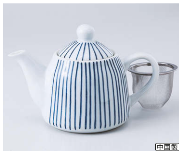
345-502-523 2,100円 線十草TYポット (10.5×11.7・410cc)