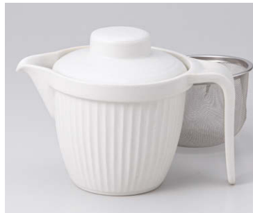
344-203-513 3,500円 嵯峨野(白)ポット (11×10.5・320cc)