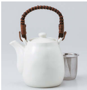
339-502-353 3,650円 セミマット 土瓶(カゴアミ付) (9×12×400cc)