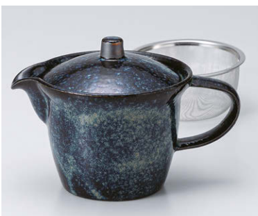
343-204-313 3,300円 紺窯変 洗い易いポット (16×10.7×11・300cc)