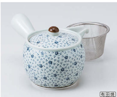
341-104-543 3,500円 風たより丸型中急須(アミ付) (11×9・400cc)