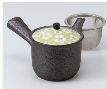
341-501-573 3,100円 お花見急須グリーン (8.9×9.5・300cc・Uアミ付)