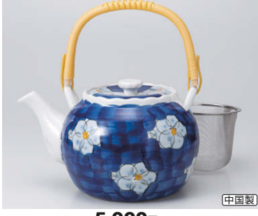
338-303-413 5,000円 ダミ間取花8号土瓶(21×12-1500cc) 338-304-413 4,000円 ダミ間取花6号土瓶(19.5×11-1070cc)