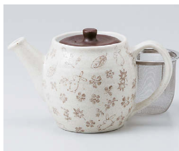
344-303-573 3,300円 花うさぎポット (9.5×10.3・420cc・Uアミ付)