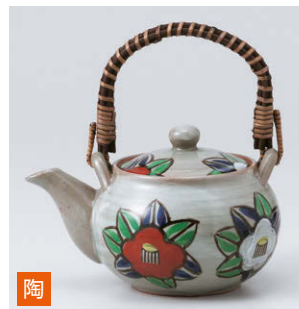
陶 339-301-513 3,400円 染錦椿(中)土瓶 (16.5×10.5×600cc)