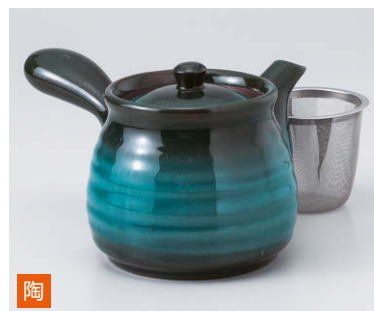
341-401-513 2,700円 深海六兵急須 (11×10.5・500cc)