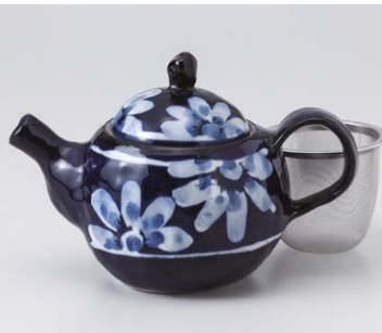
344-201-513 3,900円 小町半菊ブルーポット (9.5×12・440cc)