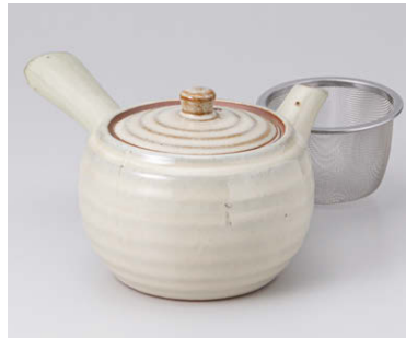
342-403-163 2,500円 白萩急須 (11×8.8・450cc)