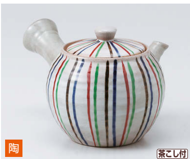
341-504-513 2,800円 十草2号小急須 (10×10.5・400cc)