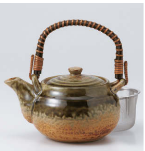
339-304-013 4,380円 グリーン伊良保5号土瓶(U・茶コシ付) (19×12×750cc)