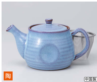
345-402-523 2,400円 ブルー均窯ポット (10.5×10・460cc)