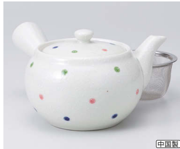
342-503-413 2,300円 水玉淡雪急須 (10.5×9・350cc)