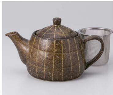
345-303-313 2,800円 錆伊賀十草 ポット急須(アミ付) (11×17.5×9.5・400cc)