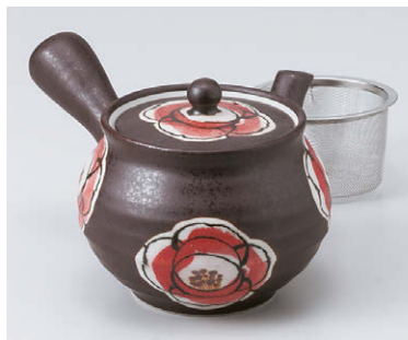
341-302-573 4,000円 錆椿急須 U茶こし付 (10.5×10.3・450cc)