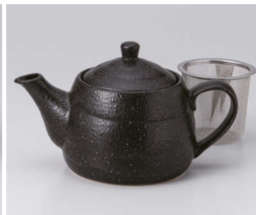
345-404-313 2,400円 黒結晶 ポット急須(アミ付) (11×17.5×9.5・400cc)