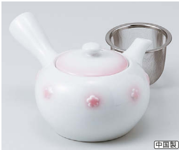
342-402-513 2,340円 染付急須 紅梅(2100-4) (14×9・390cc)