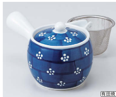
341-301-543 3,200円 梅小紋丸型中急須(アミ付) (11×9・400cc)