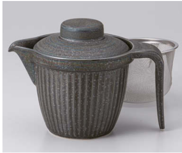
345-101-513 3,500円 嵯峨野(黒)ポット (11×10.5・320cc)