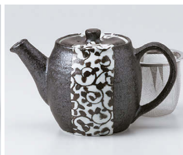
344-304-573 3,400円 唐草ポット (9.5×10.3・420cc・Uアミ付)