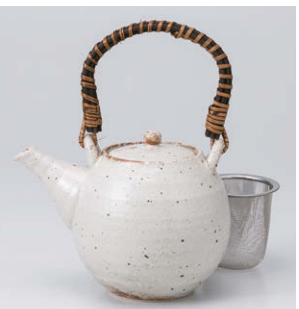
339-405-603 4,900円 サビ志野 土瓶(大) (16×10.3×11.3×530cc) 339-406-603 4,800円 サビ志野 土瓶(小) (13.5×9.4×10.1×370cc)