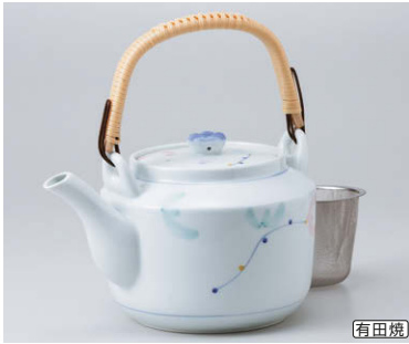
338-103-543 7,000円 スイトビー8号土瓶(アミ付) (16×13.8-1700cc) 338-104-543 5,200円 スイトビー6号土瓶(アミ付) (14.5×12-1050cc)