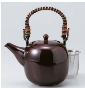
339-202-523 6,300円 うるし釉土瓶Uアミ付 (10.5×11.5×520cc)