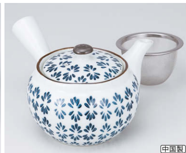
342-304-523 2,000円 花火BA急須 (11×9.3・350cc)