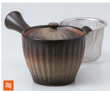
陶 343-103-513 2,700円 黒備前菊型急須 (10×9.7・380cc)