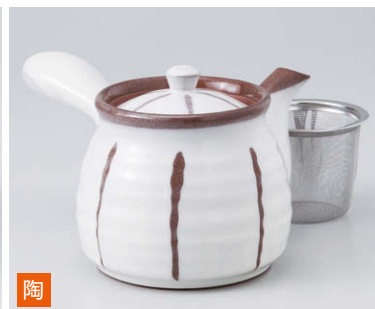
342-104-513 2,700円 白釉十草六兵急須 (11×10.5・500cc)