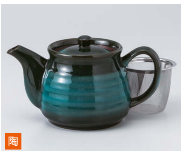
陶 343-404-513 2,700円 深海六兵衛ポット (11×10.5・500cc)