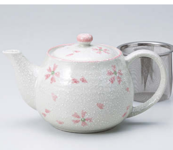
344-501-413 2,300円 さくら淡雪 軽量ポット (11×10・450cc)