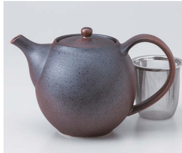
344-103-523 4,500円 黒信楽ポット(アミ付) (16×10.3×11.3・530cc)