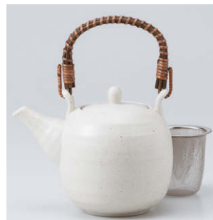
339-401-153 6,000円 粉引丸土瓶(カゴアミ付) (14.3×9.8×11.5×520cc)