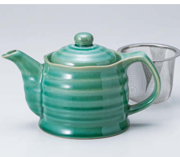
344-401-413 2,000円 トルコブルーポット (18.2×10.3×11・430cc)