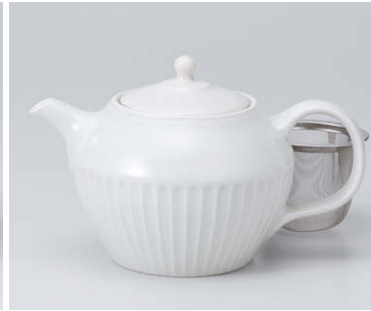
345-104-053 3,200円 削ぎ型ポット白(網付) (16×10.5×10・380cc)