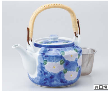
338-105-543 7,000円 紫花8号土瓶(アミ付) (16×13.8-1700cc) 338-106-543 5,200円 紫花6号土瓶(アミ付) (14.5×12-1050cc)