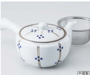
342-202-523 2,800円 十草丸紋青DB急須 (11×8.6・400cc)