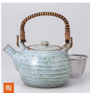
陶 339-102-543 8,500円 唐津7号土瓶 (15×11.8×1250cc)