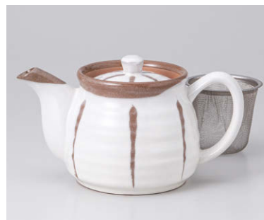
343-501-473 2,700円 京十草六兵衛ポット(カゴアミ付) (10.5×10・480cc)