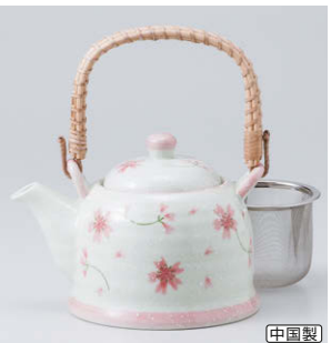
339-504-413 2,300円 土瓶 さくらさくら (16×12.5×11.5×600cc)