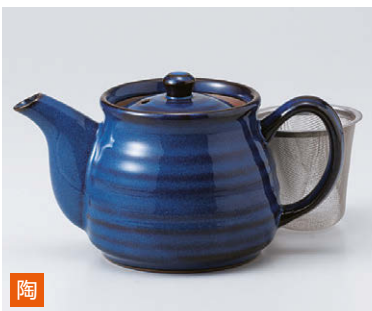
陶 343-504-543 2,700円 ナマコ六兵衛ポット(アミ付) (10.5×10・500cc)