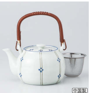
339-503-523 3,450円 十草丸紋青5号土瓶 (13×9.8×520cc)