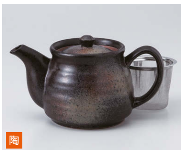
陶 343-403-513 2,700円 黒備前六兵衛ポット (11×10.5・500cc)