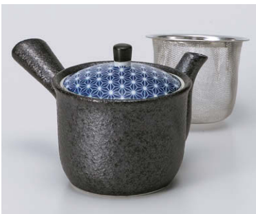
341-304-513 3,600円 色麻葉 反急須 (8×9・320cc)