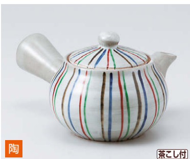
341-404-513 3,100円 錦十草 中急須 (10.5×9・400cc)