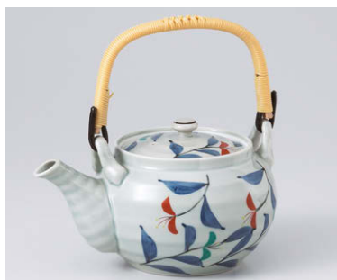
335-203-903 3,100円 思い花4号土瓶 (M) (12×10・550cc)