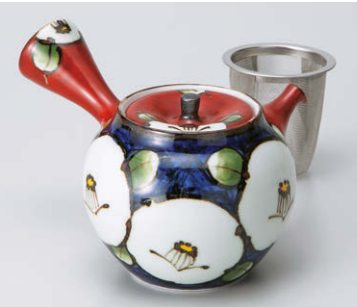
336-301-903 6,000円 濃椿小急須(U) (9×8・250cc)