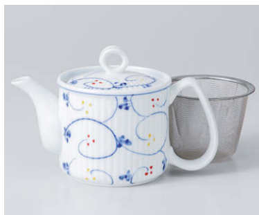
335-503-903 3,500円 点彩唐草筋彫ポット (小) (8.9×10.3・370cc)