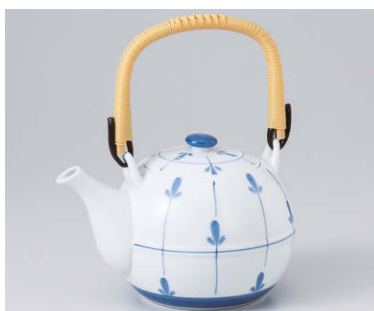
335-104-903 3,400円 めばえM5号土瓶 (12×10.4・800cc)