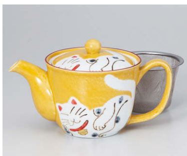
335-304-903 3,900円 招福ネコポット (U) (10×10.5・380cc)