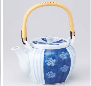
334-201-903 7,000円 線濃 10号土瓶 (16×13.7-1800cc) 334-202-903 6,200円 線濃 8号土瓶 (14.5×12.5-1400cc) 334-203-903 4,800円 線濃 6号土瓶 (12.8×11.5-1000cc)