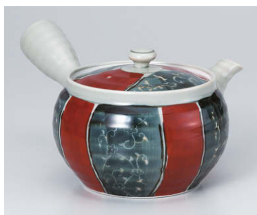
337-302-903 3,100円 桜川急須(M) (10.5×8.5・430cc)