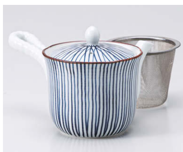
337-402-903 3,200円 千筋急須小 青(U) (9×9.5・270cc)