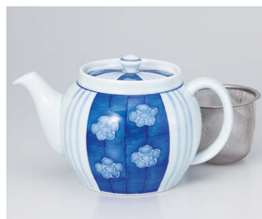
335-301-903 5,000円 京染6号 (U) ポット (13.2×12.3・1000cc)