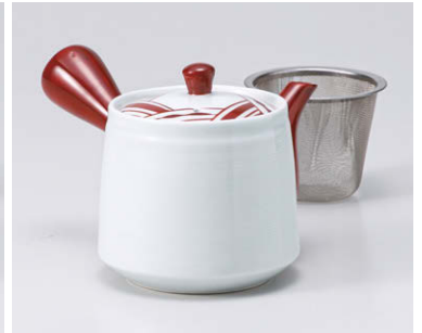
336-304-903 4,400円 綴急須 赤(U) (8.5×10.5・480cc)