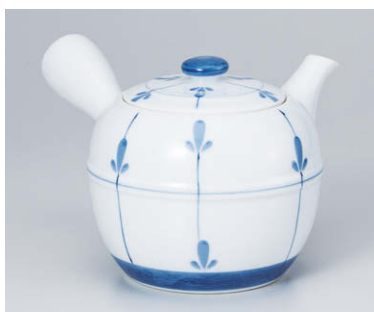
337-304-903 3,000円 めばえ急須(M) (10.8×10・500cc)