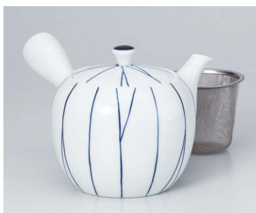
337-104-903 3,450円 手描き線急須(U) (10×11・550cc)