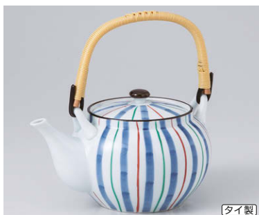
335-204-903 2,550円 古代十草 4号土瓶 (M) (12×10・600cc)