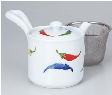
336-502-903 3,850円 色絵からし軽々急須(U) (10×11.2・480cc)