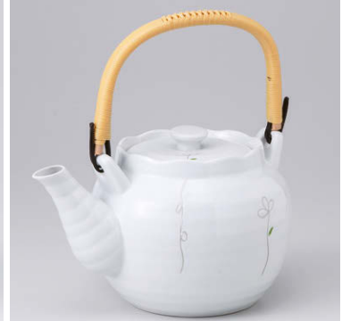
334-301-903 6,800円 小町草 10号土瓶 (16×13.7-1800cc) 334-302-903 6,000円 小町草 8号土瓶 (15×12.5-1400cc) 334-303-903 4,600円 小町草 6号土瓶 (13.5×11-1000cc)