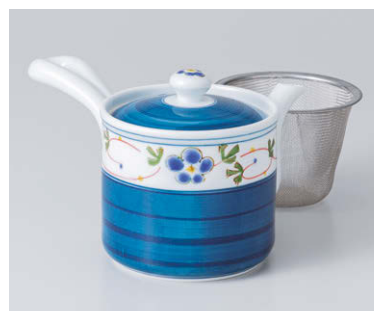
337-101-903 3,750円 色彩唐草軽々急須(小) (8.9×10.3・370cc)