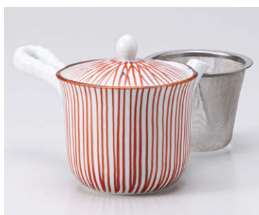
337-403-903 3,200円 千筋急須小 赤(U) (9×9.5・270cc)