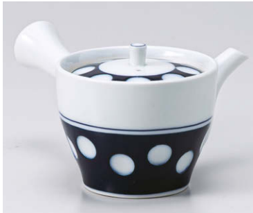
336-302-903 5,000円 水玉急須 (10×7.5・400cc)