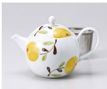
335-303-903 5,000円 モコアポット (U) (8.5×11.8・500cc)