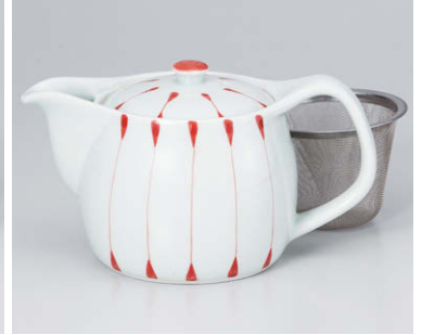
336-104-903 3,300円 線十草ポット(U) (赤) (9.8×10.4・450cc)