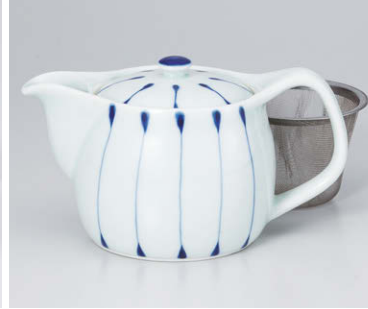
336-103-903 3,300円 線十草ポット(U) (青) (9.8×10.4・450cc)