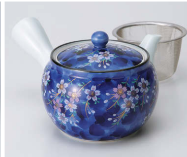
336-403-903 4,100円 華の詩急須(U) (10.5×9.2・460cc)