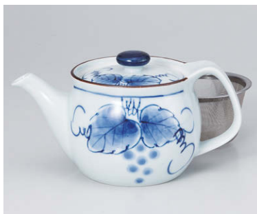
335-504-903 3,450円 古染ぶどうポット (U) (10×8.8・450cc)