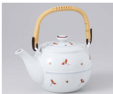
335-103-903 3,450円 あかね草5号土瓶 (M) (12.7×11.2・800cc)