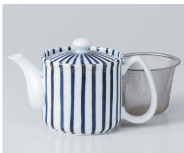
335-404-903 3,750円 十草軽々ポット (小) (8.9×10.3・370cc)