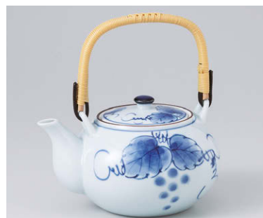
335-201-903 3,400円 古染ぶどう4号土瓶 (U) (12.8×8.8・650cc)