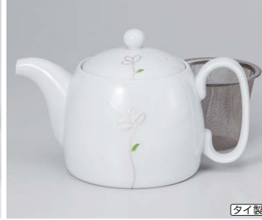
336-203-903 2,800円 銀のつぼみポット(U) (9.5×10.7・440cc)