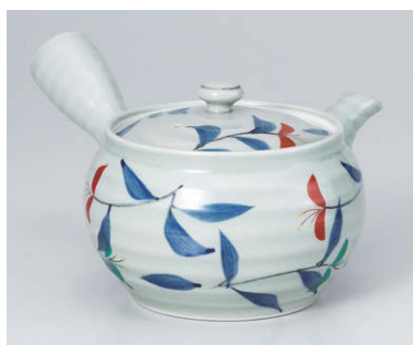
337-303-903 3,000円 思い花急須(M) (10.5×8.5・430cc)