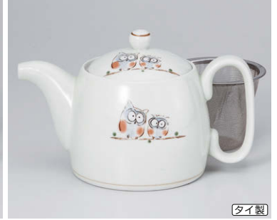
336-204-903 2,900円 ふくろうポット(U) (9.5×10.7・440cc)