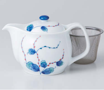
336-101-903 3,450円 水引草ポット(U) (8.9×10.2・420cc)