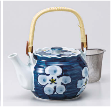
334-101-903 9,000円 鎌倉十草8号土瓶 (15×13.8-1200cc) 334-102-903 7,750円 鎌倉十草6号土瓶 (13.5×13-900cc)