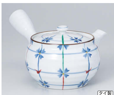
337-404-903 2,400円 錦花格子急須(M) (10.5×8.7・450cc)