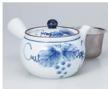
337-201-903 3,250円 古染ぶどう急須(U) (11×9・430cc)