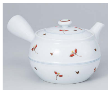
337-401-903 2,900円 あかね草急須(M) (11.5×9.2・400cc)