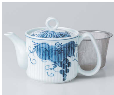
335-502-903 3,500円 ぶどう筋彫ポット (小) (8.9×10.3・370cc)