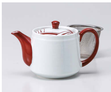
335-402-903 4,400円 緞ポット赤 (U) (8.5×10.5・480cc)