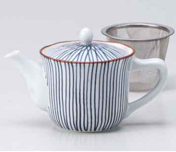
336-201-903 3,200円 千筋ポット小 青(U) (8×10・270cc)