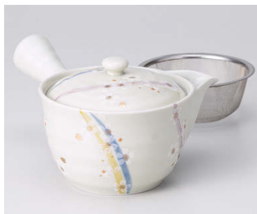
337-502-903 2,800円 流水桜 平口急須(U) (10.8×9・300cc)