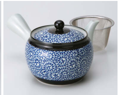
336-404-903 4,000円 唐草地紋急須(U) (10.5×9.2・460cc)