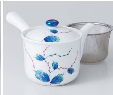
336-503-903 3,800円 水引草急須(U) (10×10.2・380cc)