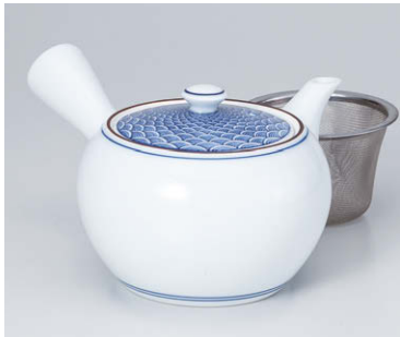
336-402-903 4,250円 青海波紋 急須(U) (11×8.7・430cc)