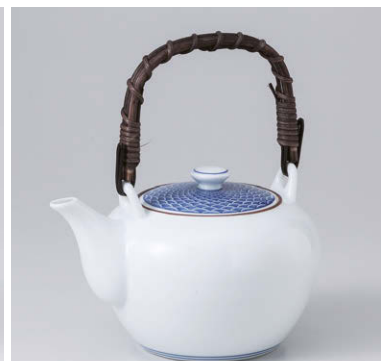
334-401-903 3,700円 古染花 角 10号土瓶 (M) (16.5×15-2000cc) 334-402-903 3,400円 古染花 角 8号土瓶 (M) (15.5×13.6-1600cc)