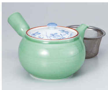
337-202-903 3,300円 グリーン花絵急須(U) (11×9・400cc)