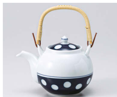
335-101-903 5,000円 水玉4号土瓶 (12×10.5・650cc)