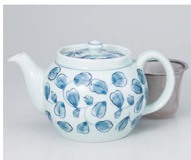
335-302-903 5,000円 古都6号 (U) ポット (13.2×12.3・1000cc)