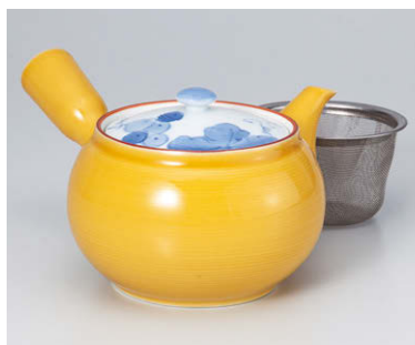
337-203-903 3,300円 黄釉ぶどう急須(U) (11×9・400cc)