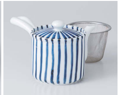
336-504-903 3,750円 十草軽々急須(小) (8.9×10.3・370cc)