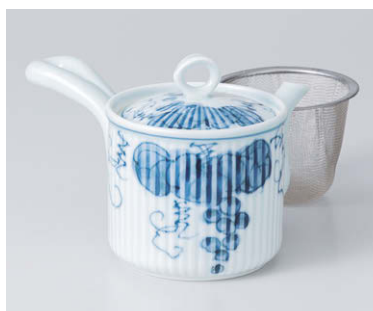
337-102-903 3,500円 ぶどう筋彫急須(小) (8.9×10.3・370cc)