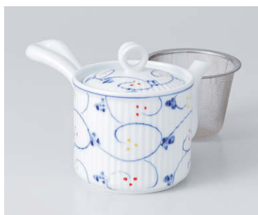
337-103-903 3,500円 点彩唐草筋彫急須(小) (8.9×10.3・370cc)