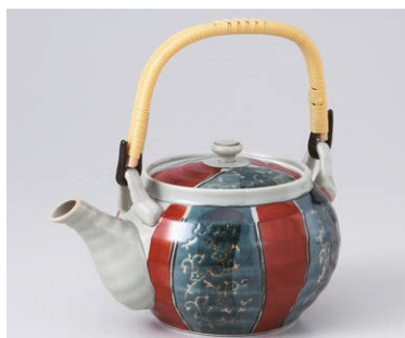
335-202-903 3,200円 桜川4号土瓶 (M) (12×10・550cc)