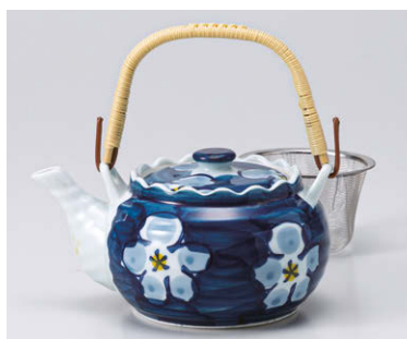
335-102-903 4,500円 ゴス白梅4号土瓶 (12.5×8・500cc)