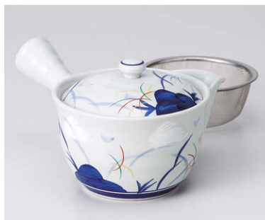
337-503-903 2,800円 野山 平口急須(U) (10.8×9・300cc)