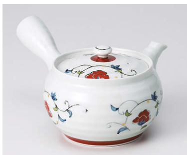
337-204-903 3,200円 草牡丹急須(M) (10.5×8.5・430cc)