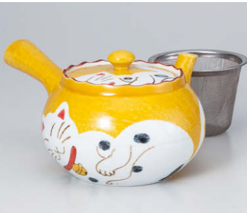
336-501-903 3,900円 招福ネコ急須(U) (11×9・500cc)