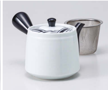
336-303-903 4,400円 綴急須 青(U) (8.5×10.5・480cc)