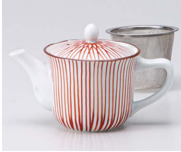
336-202-903 3,200円 千筋ポット小 赤(U) (8×10・270cc)