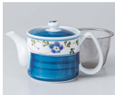
335-501-903 3,750円 色彩唐草軽々ポット (小) (8.9×10.3・370cc)