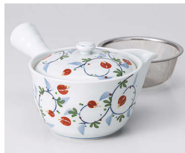
337-501-903 2,800円 赤絵唐草 平口急須(U) (10.8×9・300cc)