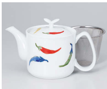
335-403-903 3,850円 色絵からし軽々ポット (U) (9.8×11・480cc)