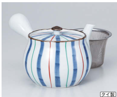
337-504-903 2,000円 古代十草小急須(U) (8.8×7.7・300cc)