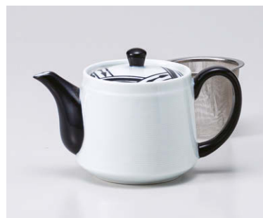
335-401-903 4,400円 緞ポット青 (U) (8.5×10.5・480cc)