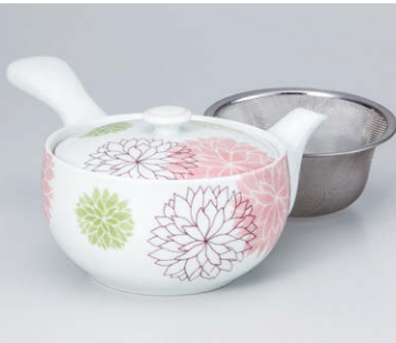
336-401-903 4,300円 大輪花 急須(U) (11.5×8.3・450cc)