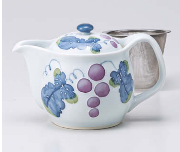
336-102-903 3,450円 マスカットポット(U) (8.9×10.2・420cc)