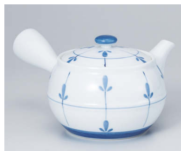
337-301-903 3,100円 めばえM3号急須 (11.5×9.2・450cc)