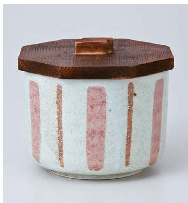
315-407-203 1,900円 あけぼの飯器(蓋11.5×9.9) 315-408-203 1,450円 あけぼの身丈(11×8)