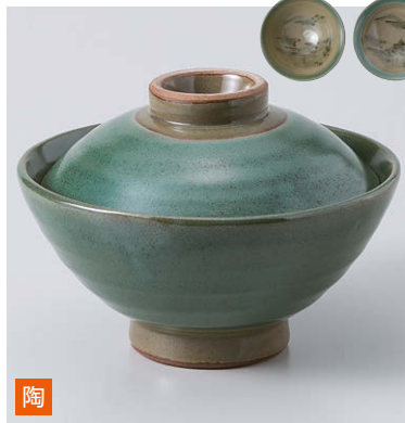
317-403-333 3,000円 青益子中山水のり茶(15.7×11.3)