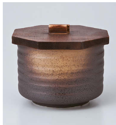
315-301-243 1,900円 金吹飯器(蓋11.5) 315-302-243 1,350円 金吹身丈(10.5×7.8)