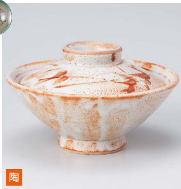
317-404-303 2,500円 赤志野竹 大茶(15.8×9.5)