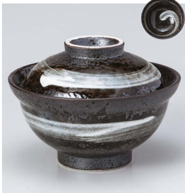
317-205-313 2,700円 うず潮5.0蓋井(15.5×11) 317-206-313 1,800円 うず潮5.0身井(15.5×7.8)