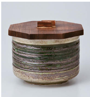
315-207-243 1,900円 ローウス飯器(蓋11.5) 315-208-243 1,350円 ローウス身丈(10.5×8)