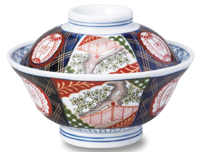
316-203-333 5,600円 錦小桜6.0蓋井 (18.2×11.8) 316-204-333 3,950円 錦小桜6.0身井 (18.2×8.5)