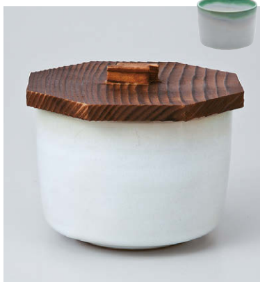
315-107-253 2,730円 新ひわらし飯器木蓋付(11.5×10) 315-108-253 2,200円 新ひわらし飯器 身(7.5×8・蓋11.5)