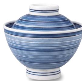
316-405-333 3,300円 濃淡駒筋4.2丸蓋井 (13×11.6) 316-406-333 2,350円 濃淡駒筋4.2丸身井 (13×8.5)