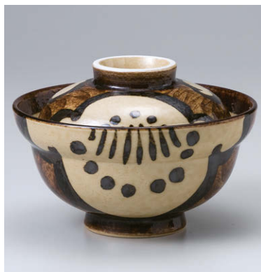
317-203-333 2,300円 イラボ濃梅5.0蓋井(15.6×11) 317-204-333 1,600円 イラボ濃梅5.0身井(15.6×8.2)