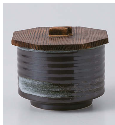
315-101-703 2,880円 鉄結晶飯器(小) (蓋(切込入り)12) 315-102-703 2,150円 鉄結晶飯器(小) 身丈(10.7×7.7)