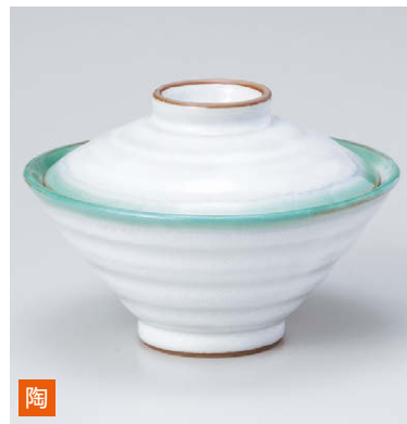
317-401-253 2,600円 新ひわ流し大茶蓋付(15×10) 317-402-253 1,800円 新ひわ流し大茶(身)(15×6.7)