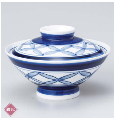
317-305-783 2,700円 ゴス巻七宝蓋付大茶(14.7×9) 317-306-783 1,650円 ゴス巻七宝大茶身(14.7×8)