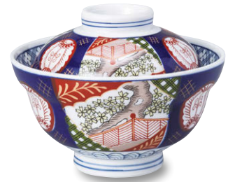
316-307-333 4,400円 錦小桜5.0蓋井 (15.5×11.5) 316-308-333 3,100円 錦小桜5.0身井 (15.5×8.7)