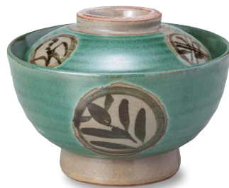
陶 316-403-333 4,300円 青益子三紋高台蓋井 (15.8×12) 316-404-333 3,000円 青益子三紋高台身井 (15.8×9)