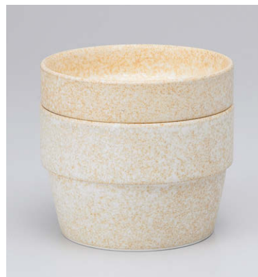
315-201-743 2,160円 マット飯器身丈(10.7×7.3) 315-202-743 1,160円 マット飯器蓋丈(10.8×2.7)