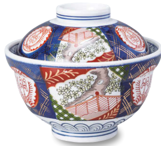
316-303-303 5,700円 錦小桜5.5蓋井 (16.3×14) 316-304-303 4,000円 錦小桜4.5蓋井 (14×10.7)