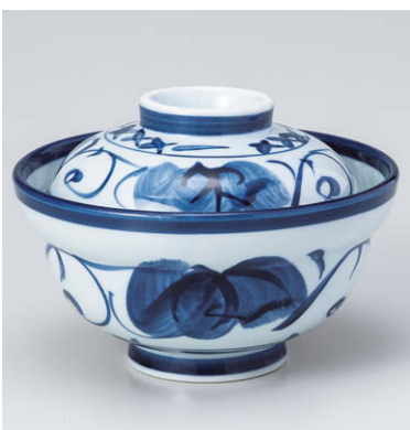
317-108-333 2,300円 濃ツタ5.0蓋井(15.6×11) 317-109-333 1,600円 濃ツタ5.0身井(15.6×8.5)