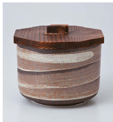
315-401-203 1,900円 南蛮ハケメ飯器(蓋11.5×9.9) 315-402-203 1,450円 南蛮ハケメ身丈(11×8)