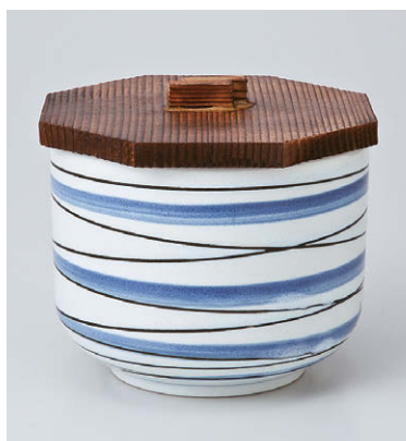
315-103-253 2,730円 流水飯器(11.5×10) 315-104-253 2,200円 流水飯器 身(10.5×8・蓋11.5)