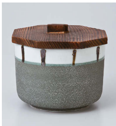
315-403-203 1,900円 黒伊賀飯器(蓋11.5×9.9) 315-404-203 1,450円 黒伊賀身丈(11×8)