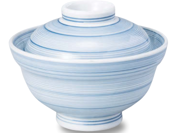
316-407-303 3,000円 千段駒筋5.0蓋井 (15.7×12) 316-408-303 2,900円 千段駒筋4.5蓋井 (14×11)