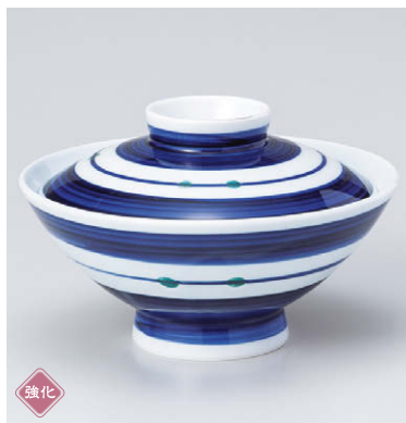
317-303-703 3,310円 ゴス巻梅蓋付大茶(14.7×9) 317-304-703 1,990円 ゴス巻梅大茶身(14.7×6.6)