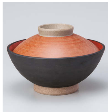
317-301-703 2,940円 黒塗内朱蓋付大茶(14.6×9.3) 317-302-703 1,770円 黒塗内朱大茶身(14.6×6.7)