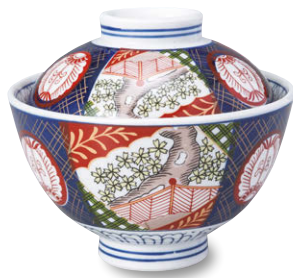
316-301-333 4,300円 錦小桜蓋付牛井 (14.8×12) 316-302-333 3,100円 錦小桜牛井 (身) (14.8×9.2)