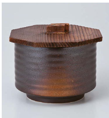
315-105-703 2,850円 焼締飯器(小) (蓋(切込入り)12) 315-106-703 2,100円 焼締飯器(小) 身丈(10.7×7.7)