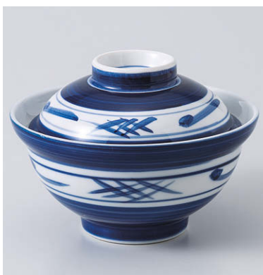
317-106-333 2,700円 紺井桁5.0蓋井(15.7×11.7) 317-107-333 1,800円 紺井桁5.0身井(15.7×7.8)