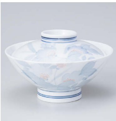
317-307-263 3,800円 まごころのり茶(15×9.5) 317-308-263 2,300円 まごころのり茶身(15×7)