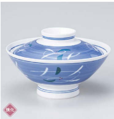
317-405-743 2,700円 彫唐草蓋付大茶(14.5×9)