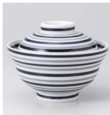
317-101-333 3,300円 二色駒筋5.0蓋井(15.5×10.8) 317-102-333 2,350円 二色駒筋5.0身井(15.5×8.4) 317-103-333 3,200円 二色駒筋4.5蓋井(14.3×10) 317-104-333 2,250円 二色駒筋4.5身井(14.3×8)