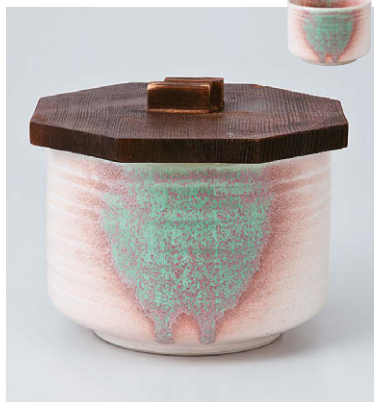
315-205-153 2,000円 ヒスイ吹き飯器蓋付(10.7×9.8) 315-206-153 1,520円 ヒスイ吹き飯器身丈(10.7×7.8・蓋11.5)