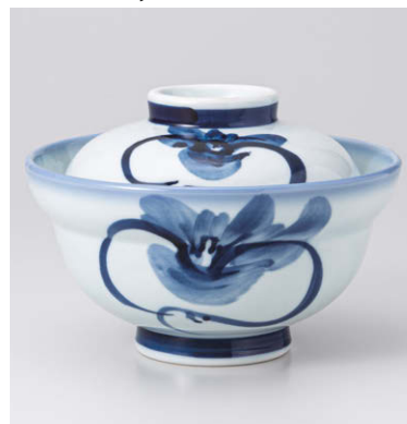
317-201-333 2,300円 手描かぶら5.0蓋井(15.6×11) 317-202-333 1,600円 手描かぶら5.0身井(15.6×8.2)