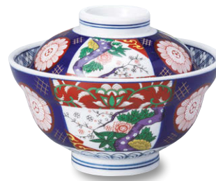
316-305-333 4,100円 錦牡丹5.0蓋井 (15.5×11.5) 316-306-333 2,900円 錦牡丹5.0身井 (15.5×8.7)