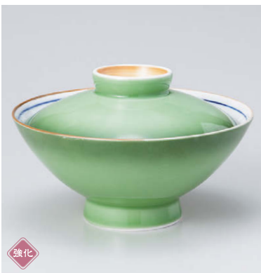
317-207-743 3,300円 緑彩蓋付大茶(14.6×9.4)