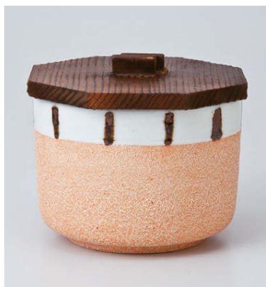
315-405-203 1,900円 赤伊賀飯器(蓋11.5×9.9) 315-406-203 1,450円 赤伊賀身丈(11×8)