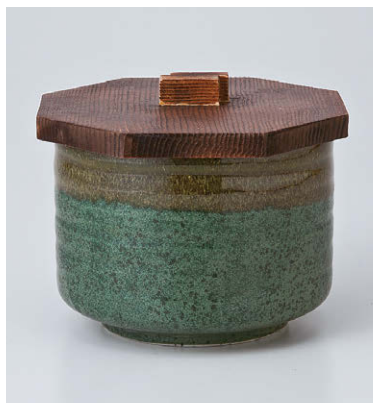
315-303-243 1,900円 わさび染飯器(蓋11.5) 315-304-243 1,350円 わさび染身丈(10.5×7.5)