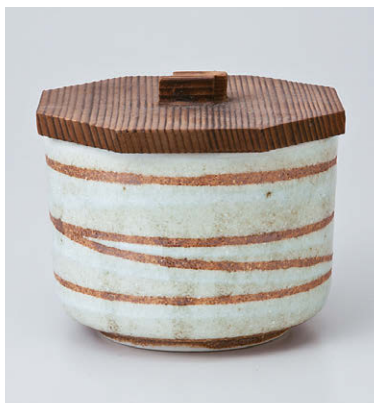
315-307-203 1,900円 信楽白ライン飯器(蓋11.5×9.9) 315-308-203 1,450円 信楽白ライン身丈(11×8)