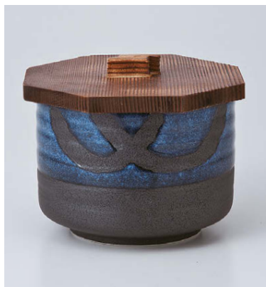
315-305-243 1,900円 天目青結晶飯器(蓋11.5) 315-306-243 1,350円 天目青結晶身丈(10.5×7.5)