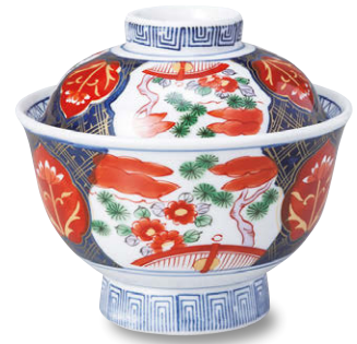
316-101-333 6,000円 錦松菊高台蓋井 (15.7×14.3) 316-102-333 4,200円 錦松菊高台身井 (15.7×10.3)