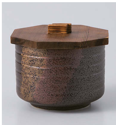
315-203-153 2,000円 備前飯器 蓋付(10.7×9.8) 315-204-153 1,520円 備前飯器身丈(10.7×7.8・蓋11.5)