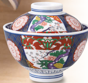
316-201-333 4,300円 錦牡丹蓋付牛井 (14.8×12) 316-202-333 3,100円 錦牡丹牛井 (身) (14.8×9.2)