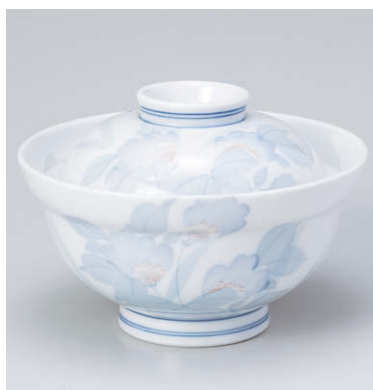
317-105-263 3,800円 まごころ蓋井(15.8×10.7)