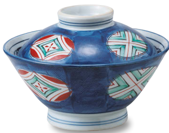
陶 316-401-333 4,600円 布目菱紋切立蓋井 (16.7×11.5) 316-402-333 2,900円 布目菱紋切立身井 (16.7×7.9)