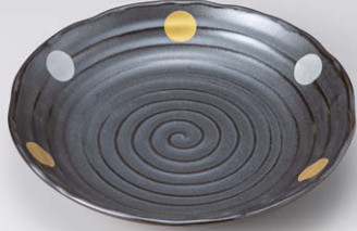
280-302-313 1,500円 金銀丸紋鉄結晶 7.0深皿 (22×4)