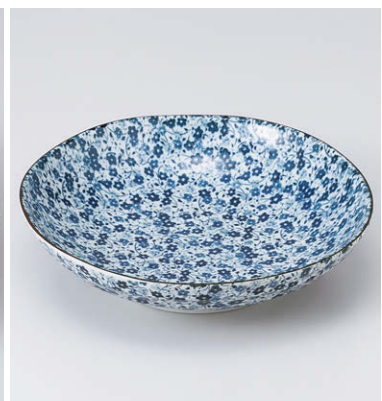
283-404-163 800円 藍染小花6.8深皿 (21×5.2)