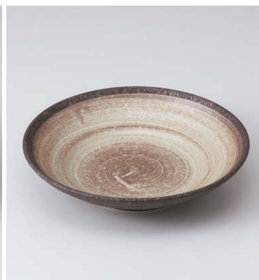
279-404-263 1,150円 刷毛粉引23cm盛鉢 (23×5)