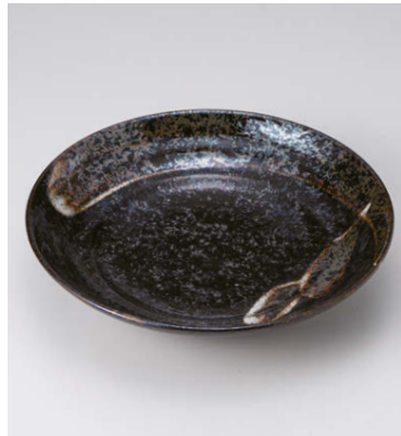
281-203-543 1,000円 明世荒刷毛7.5めん皿 (22.8×5)