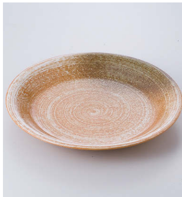
279-302-633 1,960円 信濃路9.0深皿 (28×4) 279-303-633 1,680円 信濃路8.0深皿 (24.5×3.5)