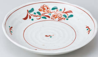
280-101-473 1,900円 粉引花万暦7.0深皿 (22×4)