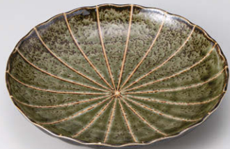
280-201-313 1,400円 深緑十草 菊型7.5皿 (23×4.3)