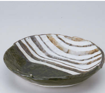
278-202-783 3,900円 織部ストライプ7.5丸鉢 (23×4.5)