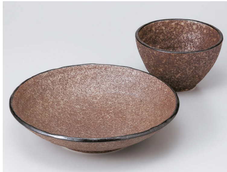
287-201-543 1,600円 アース 茶 手捻8.0盛皿(24×5.6) 287-202-633 910円 earth手びねり姫井(13.2×8)