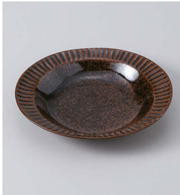
279-201-633 2,470円 窯変天目22.5cm精円皿 (22.5×20.7×4)