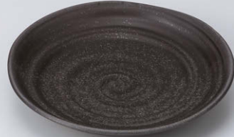
280-104-613 1,600円 彩華8.0皿黒 (23×3.8) 280-105-613 1,000円 彩華6.5皿黒 (20.6×4.4)