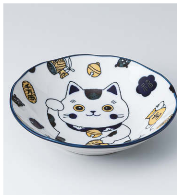
286-303-013 770円 縁起猫 8吋クーブ 紺 (20.6×5)