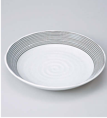
282-102-523 1,400円 ドリームライン白カレー皿 (21.8×4)