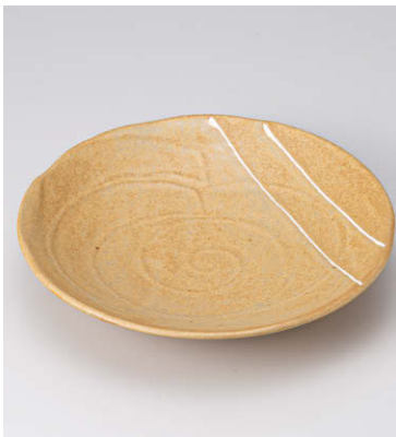
286-202-413 750円 民芸三彩 ベージュ珍 7.0深皿 (21×3.8)