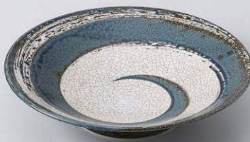
284-201-083 2,850円 うず刷毛貫入8.0めん鉢紺ねず (24.5×7.5)