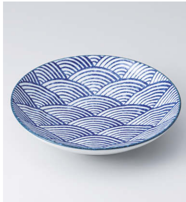
281-202-543 1,000円 白雪青海波7.5めん皿 (22.8×5)