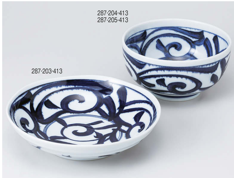
287-203-413 850円 藍草紋六兵6.8深皿(21.2×5.2) 287-204-413 1,050円 藍草紋5.0お好み井(16.2×8.5) 287-205-413 800円 藍草紋4.0お好み碗(13.4×7.3)