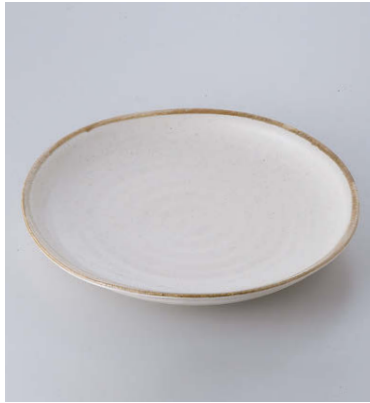
281-101-253 1,450円 粉引7.0皿 (23×3.2)