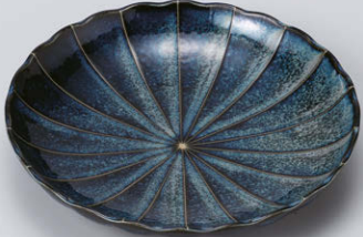
280-202-313 1,400円 窯変紺十草 菊型7.5皿 (23×4.3)