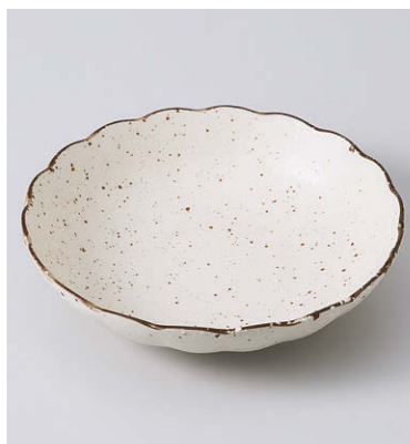
283-402-603 850円 白化粧6.8深皿 (20.7×5.2)