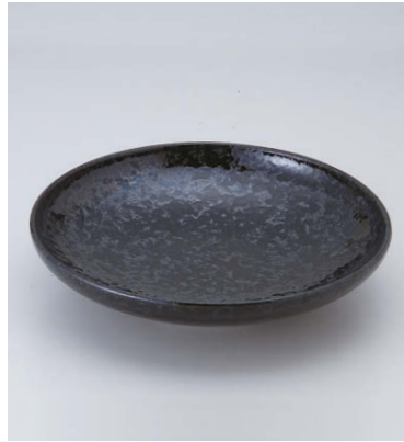
279-103-333 2,700円 あい染7.5深皿 (23×5.5)