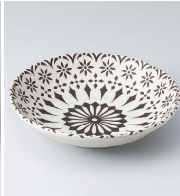
283-103-013 1,000円 ザフラ 粉引白マット 8吋スープ (20.5×4.5)