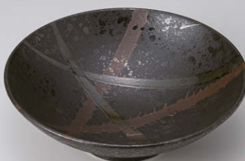
284-401-633 1,850円 東雲(黒)8寸盛鉢 (24.3×8)