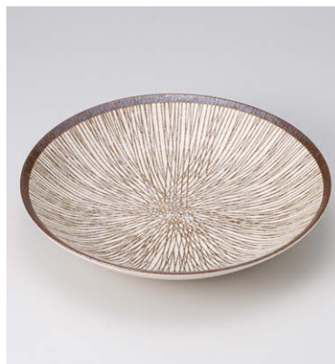
285-303-633 1,100円 さび乱十草 23cm鉢(23×4.6)