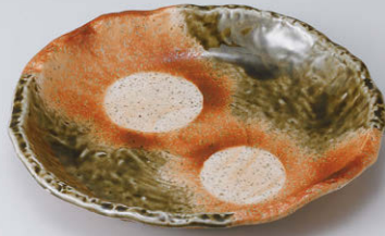
278-102-513 4,600円 嵯峨野8.5深皿 (26×25.3×3.8)