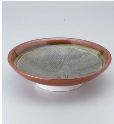
285-103-303 2,600円 赤釉クシメ7.5高台皿(22.5×6.3)