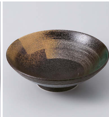
285-204-243 1,800円 新錦グリーン吹8.0盛鉢(24×8)