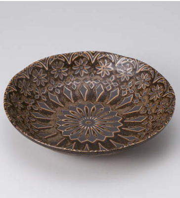
286-101-013 1,000円 ザフラ 伊賀マツ 8吋スープ (20.5×4.5)