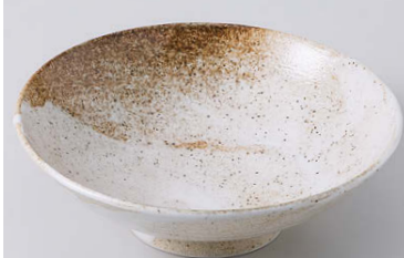
284-404-243 1,800円 雪志野8.0盛鉢 (24×8)