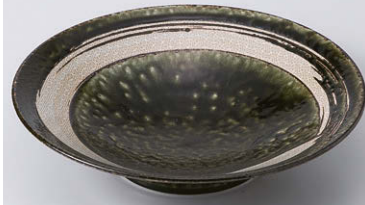
284-104-083 2,900円 黒織部8.0麵鉢 (24.5×7.5)