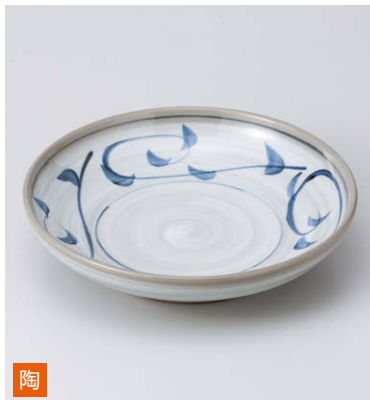
285-201-333 2,900円 古代安南7.5麺皿(22.5×5.4)