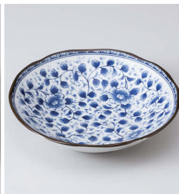
283-403-013 770円 藍染牡丹7.0深皿 (21.5×5)