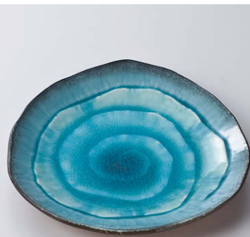
278-402-353 3,000円 藍染スカイ 三角9.0皿 (26.5×26.5×4)