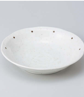
282-201-313 980円 粉引ドット7.0深皿 (21.5×4.5)