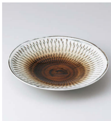
279-403-353 1,650円 飛び鉤(白)7.0深皿 (22.3×4)