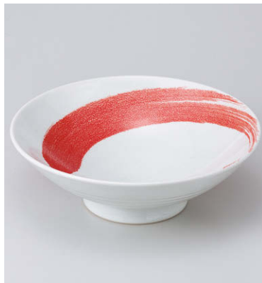
285-202-263 1,900円 赤刷毛8.0盛鉢(24.4×7.9)