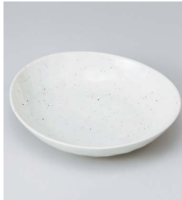
282-203-413 720円 雪粉引 楕円21カレー皿 (21×20.3×4.6)