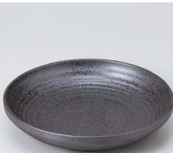
278-302-253 3,240円 黒結晶8.0皿 (25.5×5)