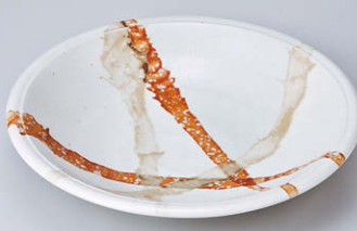
280-303-633 1,250円 東雲(白) 7.5深皿 (23×4.4)