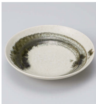
281-402-243 1,000円 憩い7.5麺皿 (22.8×5)