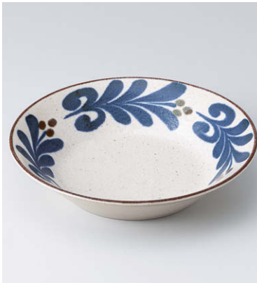
282-402-053 800円 ばいかじ7.0深皿 風 (21.5×4.6)