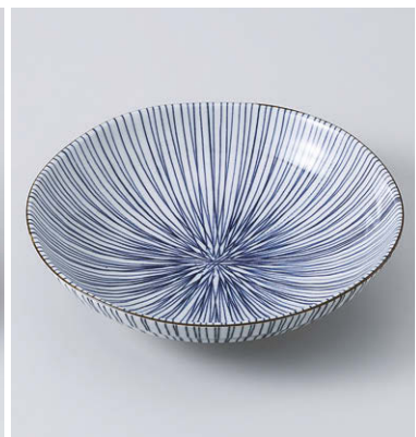
283-304-413 850円 細十草6.8深皿 (21×5.2)