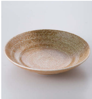
281-201-633 1,050円 信濃路7.5浅鉢 (23×5)