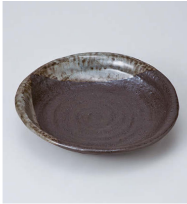
279-101-513 3,200円 柳ヶ瀬 舞煮物鉢 (22.9×21.7×4.3)