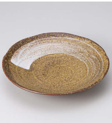
286-201-413 750円 民芸三彩 こげ茶吹き 7.0深皿 (21×3.8)