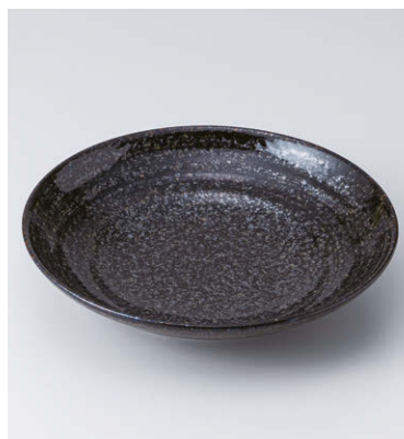
281-403-243 1,000円 風音夜風7.5麺皿 (22.8×5)