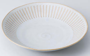
280-404-013 1,050円 撥水十草 9吋スープ皿 灰うのふ (23×4.5)