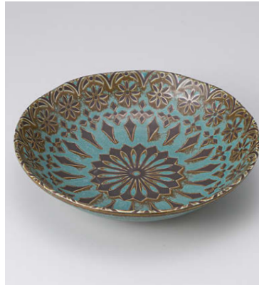
286-103-013 1,000円 ザフラ 緑青 8吋スープ (20.5×4.5)