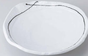
278-103-513 4,900円 黒結び石目大皿 (26.5×5)