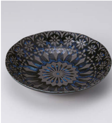
286-102-013 1,000円 ザフラ 海碧 8吋スープ (20.5×4.5)