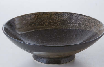
284-403-543 1,800円 明世荒刷毛8.0盛鉢 (24.5×8)