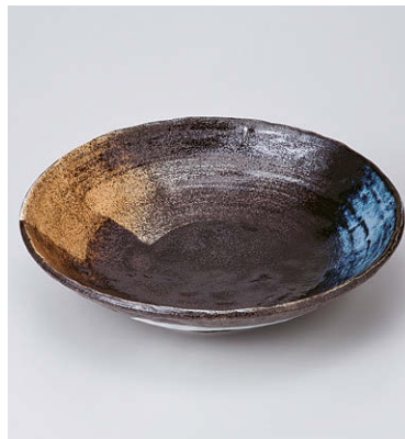
285-203-243 1,700円 刷毛巻手ひねり8.0盛鉢(24×5.5)