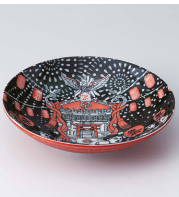
286-401-013 950円 祭り 7.0盛皿 (21.8×5.5)