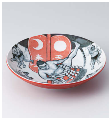
285-402-013 950円 相撲 7.0盛皿(21.8×5.5)