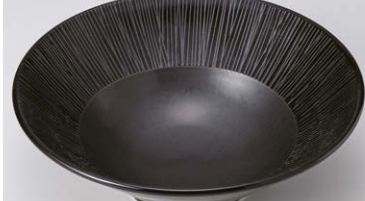
284-204-633 2,100円 DN (BK) ポウル24 (24×8)