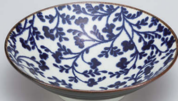
284-303-613 2,200円 おふけ草花8.0めん鉢 (24.5×7.5)