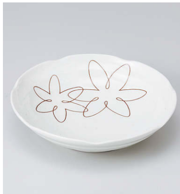
283-202-513 800円 ゆうか白6.8深皿 (20.5×5)