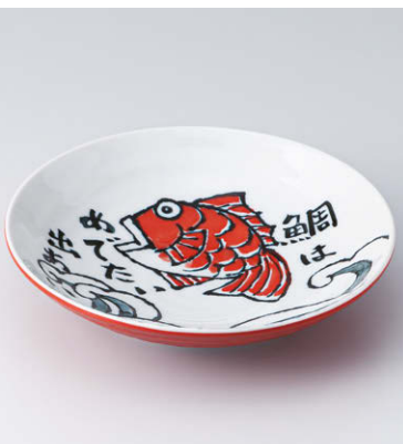
286-301-013 950円 めで鯛 7.0盛皿 赤 (21.8×5.5)