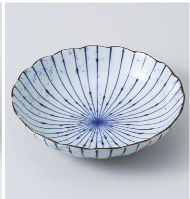
283-204-413 850円 吹墨十草菊型6.8深皿 (20.7×5.2)