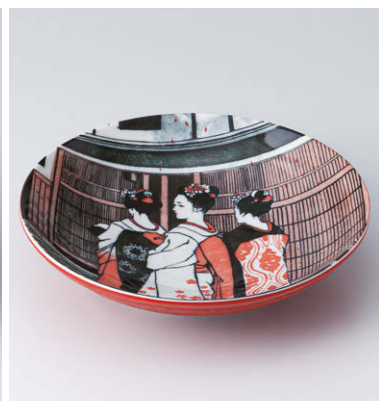
286-404-013 950円 舞妓 7.0盛皿 (21.8×5.5)