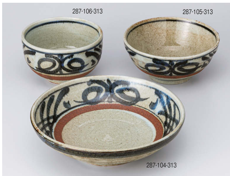
287-104-313 2,640円 信楽唐草7.5深皿(23.5×6.5) 287-105-313 1,700円 信楽唐草玉5.5井(16.7×7.7) 287-106-313 1,380円 信楽風唐草4.5井(14×8.5)