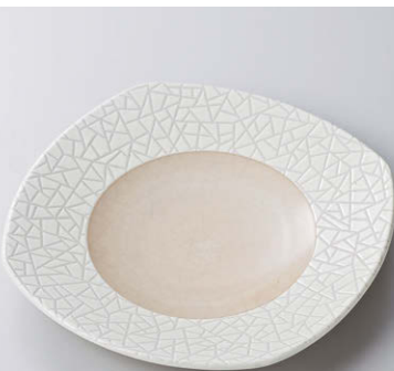
278-401-513 2,900円 クリーム輪二重9.5角皿 (27.6×4.3)