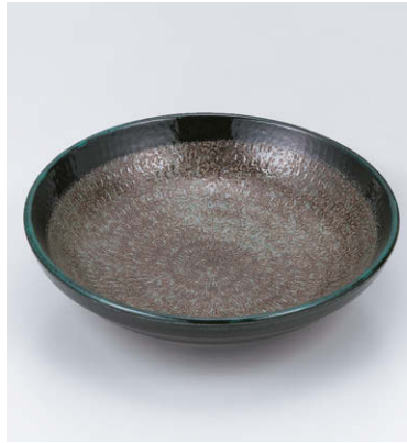
285-102-353 2,650円 結晶グリーン7.5めん皿(23.3×6.4)