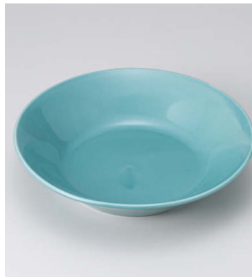
286-203-403 680円 青白磁新形 7.0深皿 (21×4)