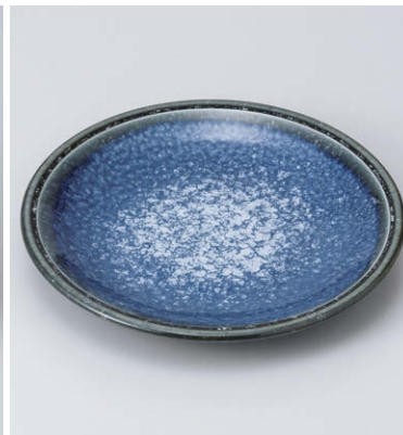
279-305-263 1,700円 すぶらっしゅ巧み27cm皿 (27×3.7)