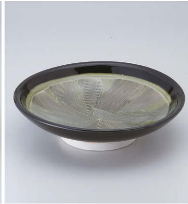
285-104-303 2,600円 黒釉クシメ7.5高台皿(22.5×6.3)