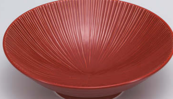
284-202-613 2,400円 千段朱 千段8.0麵鉢 (24.5×7.5)