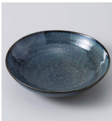
283-401-603 850円 窯変紺 六兵衛6.8深皿 (21×5.2)