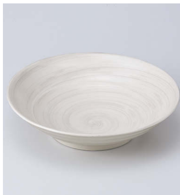
285-302-403 1,480円 新粉引8.0大鉢(25×6.5)