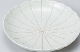
280-203-313 1,400円 粉引十草 菊型7.5皿 (23×4.3)