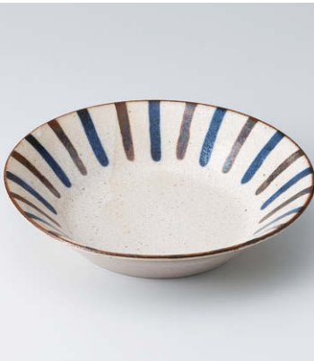
282-401-403 800円 二色十草 7.0深皿 (21.5×5)