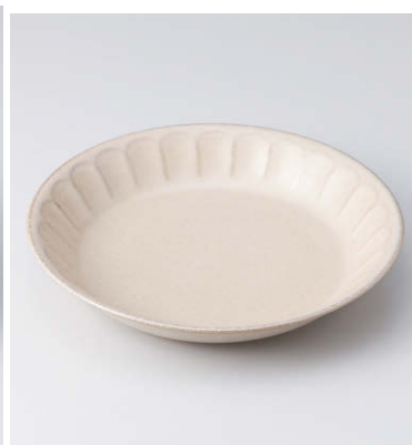
281-304-263 1,100円 ブルームスモーキーグレー22cmディーププレート (22×4)