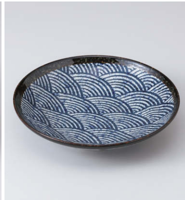
281-204-543 1,000円 青海波7.5めん皿 (22.8×5)