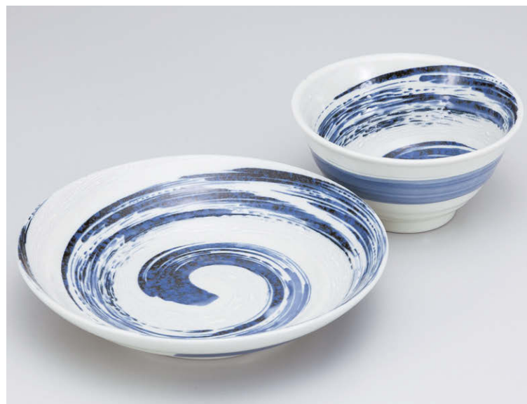
287-301-253 1,200円 粉引吹き青流7.5麺皿(23×5) 287-302-543 950円 粉引青流5.0反種井(15.4×7.8)