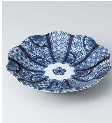
282-303-333 880円 紺青花6.3深皿 (21.3×4)