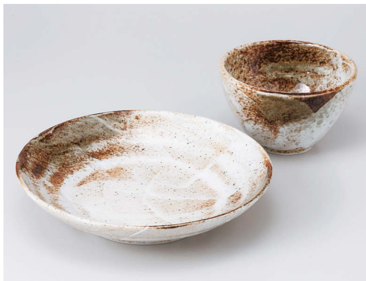
287-303-543 1,000円 雪志野7.5めん皿(22.8×5) 287-304-543 950円 雪志野 手捻姫井(13.3×8.2)