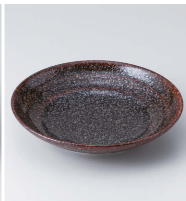
281-404-243 1,000円 風音夕風7.5麺皿 (22.8×5)