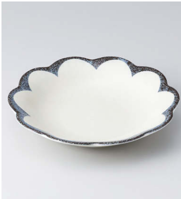
282-302-263 900円 RINKA 紺 21.5cm深皿 (21.5×4)