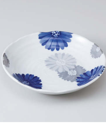
282-101-523 1,300円 菊花紋青 カレー皿 (21.8×4)