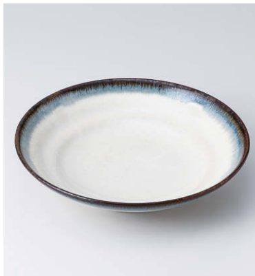
281-301-633 1,000円 オーロラ 7.5めん皿 (22.8×5)