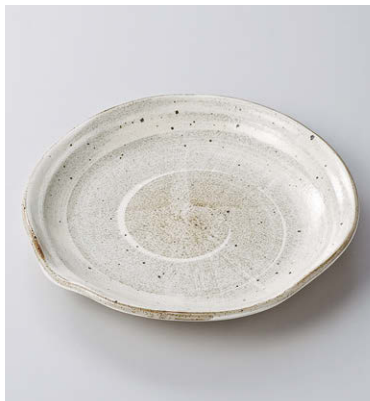
279-301-333 2,500円 渦刷毛片口大皿 (25×24.5×4.5)