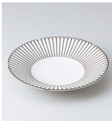
279-402-353 1,200円 光彩(白)7.0深皿 (22.3×4)