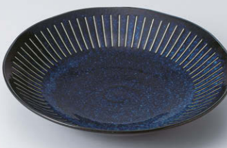
280-403-013 1,050円 撥水十草 9吋スープ皿 海碧 (23×4.5)