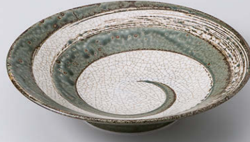
284-103-083 2,850円 うず刷毛貫入8.0めん鉢うぐいす (24.5×7.5)