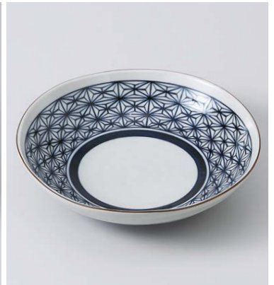
282-204-353 930円 古染小紋六兵6.8深皿 (21×5.2)