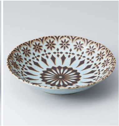
283-104-013 1,000円 ザフラ 水色うのふ 8吋スープ (20.5×4.5)