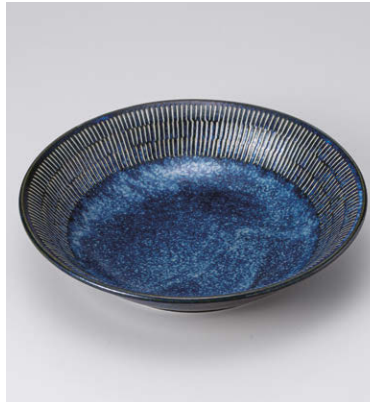
283-102-313 1,000円 窯変紺トチリ 21.5cm深プレート (21.5×4.5)