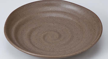
280-106-613 1,600円 彩華8.0皿茶 (23×3.8) 280-107-613 1,000円 彩華6.5皿茶 (20.6×4.4)