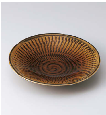
279-401-353 1,650円 飛び鉤(アメ)7.0深皿 (22.3×4)