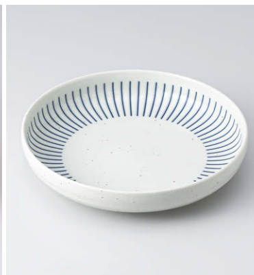
285-304-013 880円 粉引紺十草 M/パスタ(20×4.1)