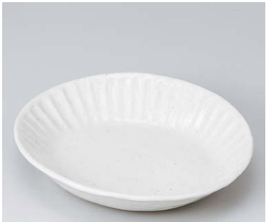
278-204-513 3,150円 ソギ白粉引楕円鉢 (大) (23×21.1×4.6)