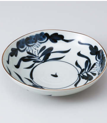
282-301-353 930円 古代草花六兵6.8深皿 (21×5.2)