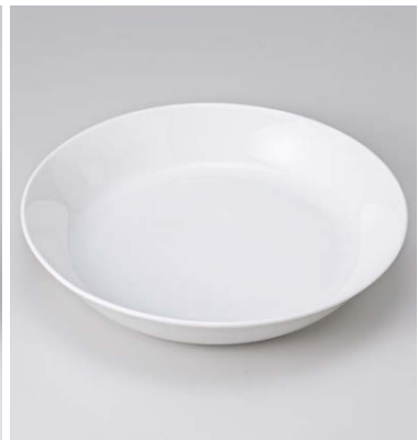
286-204-563 620円 切立型 8吋パスタプレート (22.3×4.2)