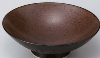
284-302-263 2,050円 JベジBR24.5高台盛鉢 (24.5×8)