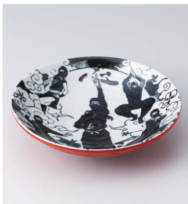
285-401-013 950円 忍者 7.0盛皿 黒(21.8×5.5)