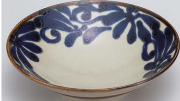
284-304-613 2,200円 琉球るり唐草8.0めん鉢 (24.5×7.5)