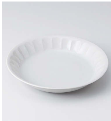
281-303-263 1,100円 ブルームホワイト22cmディーププレート (22×4)