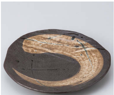
278-304-253 3,000円 流木9.0変型皿 (27×26.5×3.8)