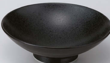
284-301-263 2,050円 JベジBK24.5高台盛鉢 (24.5×8)