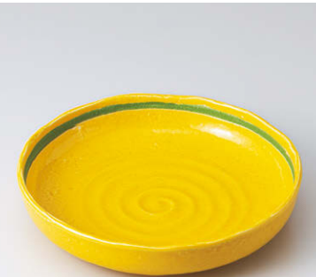
278-201-263 3,600円 黄釉ボール 大 (22×4.3)