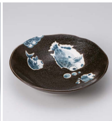
285-404-013 770円 魚三味 7.0深皿(20.6×4.5)