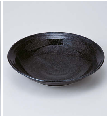
281-104-253 1,400円 黒結晶7.0深皿 (22.3×4.5)