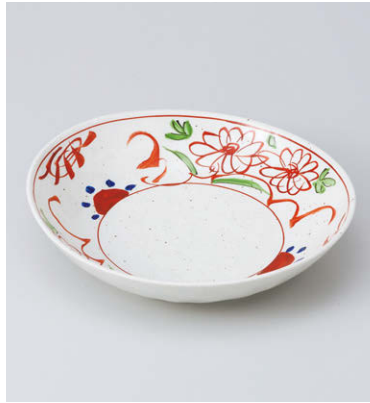
281-102-303 1,350円 粉引古赤絵楕円7.0深皿 (21.5×20.3×4.9)