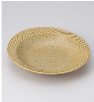
279-202-613 2,300円 タークカレー皿 黄マット (22.7×21×4.5)