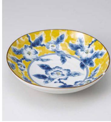
282-103-513 930円 黄彩花紋 六兵6.8深皿 (21×5.2)