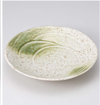
286-104-413 750円 民芸三彩 織部吹き 7.0深皿 (21×3.8)