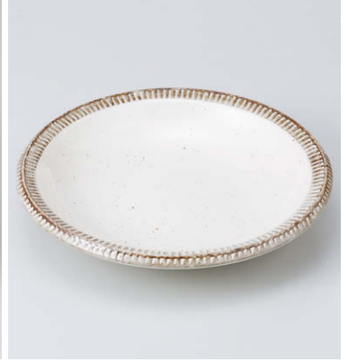
282-104-253 960円 測鑄粉引測十草 8吋スープ (21.2×4.3)