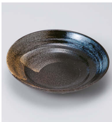
281-401-243 1,000円 新錦7.5麺皿 (22.8×5)