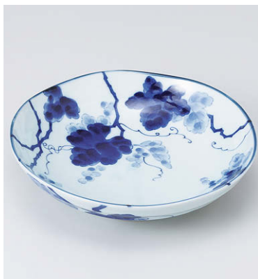
283-301-413 850円 藍染ぶどう6.8麺皿 (21.2×5.2)