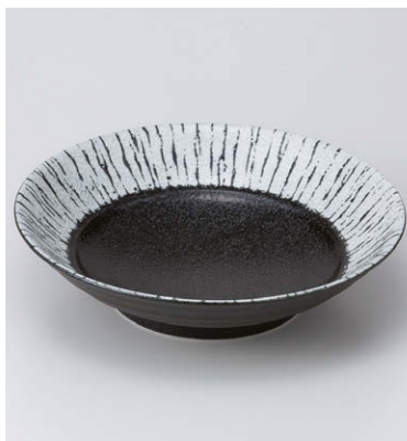
285-301-403 1,480円 黒潮8.0大鉢(25×6.5)