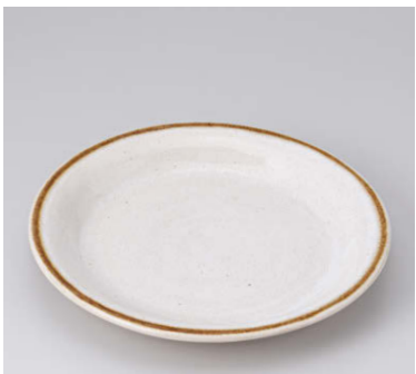
278-404-253 2,520円 瀏サピライン23cm深皿 (23×3)