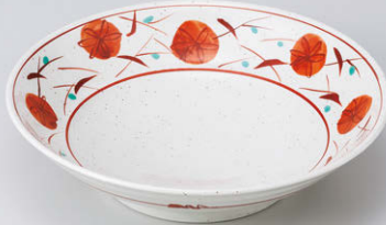
284-102-263 4,000円 錦草花盛鉢 (25×6.4)