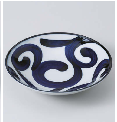
282-404-403 600円 鳴門唐草7.0浅鉢 (21.5×5)