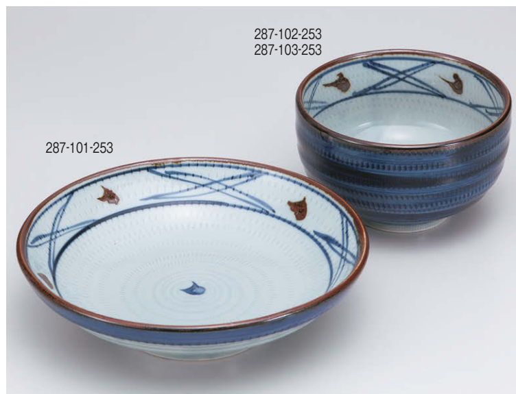
287-101-253 3,300円 呉須巻錆点7.5めん皿(23.5×6.3) 287-102-253 2,000円 呉須巻錆点5.0井(15.3×8.7) 287-103-253 1,500円 呉須巻錆点4.5井(13.5×8.5)