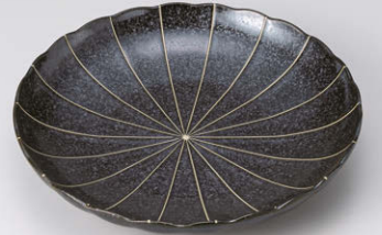
280-204-313 1,400円 黒マツ十草 菊型7.5皿 (23×4.3)