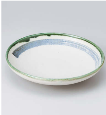
285-101-253 3,360円 瀏織部7.5めん皿(23.5×5)