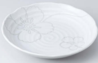
280-401-523 1,300円 ポビーズカレー皿 (21.8×4)

波佐見焼 特選 茶漬碗 飯碗 土瓶 ポット 急須 湯呑 千茶 カスター 卓上小物 箸置 レンゲ スプーン 灰皿