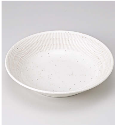
283-101-313 1,000円 粉引トチリ 21.5cm深プレート (21.5×4.5)