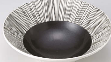
284-203-633 2,100円 DN (WH) ポウル24 (24×8)