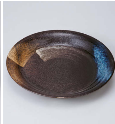
279-204-243 2,200円 刷毛巻9.0深皿 (28.2×4)