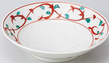
284-101-263 4,000円 錦唐草盛鉢 (25×6.4)