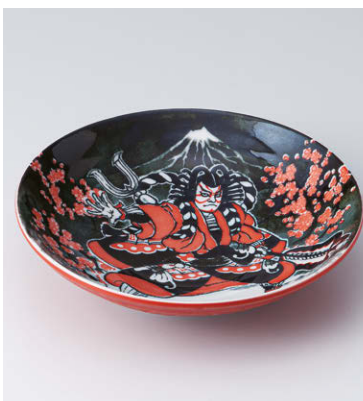
286-402-013 950円 歌舞伎 7.0盛皿 (21.8×5.5)