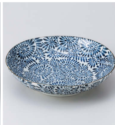
283-303-603 850円 藍染タコ唐草6.8深皿 (21×5.2)