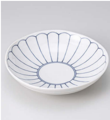
282-202-013 920円 菊線 六兵6.8深皿 (21×5.2)