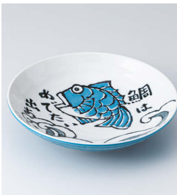
286-302-013 950円 めで鯛 7.0盛皿 青 (21.8×5.5)