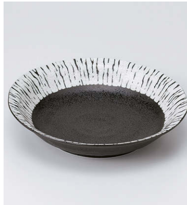
282-403-403 600円 黒潮7.0浅鉢 (21.5×4.5)