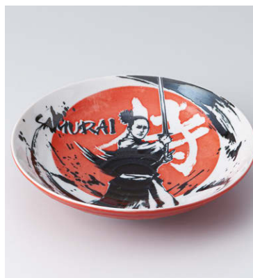
286-403-013 950円 侍 7.0盛皿 (21.8×5.5)