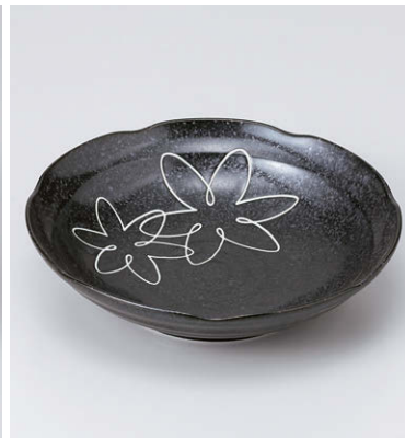
283-203-513 800円 ゆうか黒6.8深皿 (20.5×5)