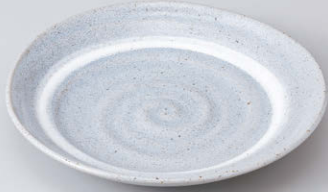
280-102-613 1,600円 彩華8.0皿まゆ (23×3.8) 280-103-613 1,000円 彩華6.5皿まゆ (20.7×4.4)