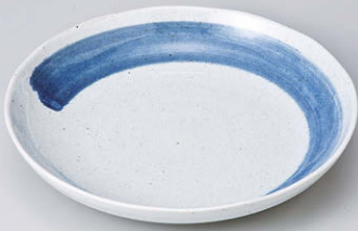
280-301-513 1,350円 清瀬 新 Pasta 皿 (22.5×4)