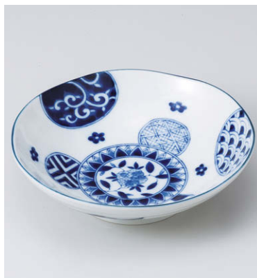
283-302-413 850円 藍丸紋六兵6.8深皿 (21.2×5.2)