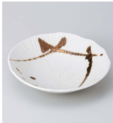
279-304-353 1,950円 金色流し大鉢 (24×22.5×5.5)