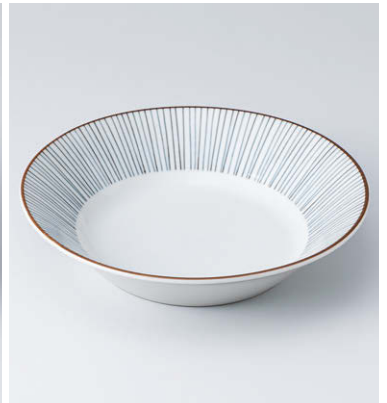
282-304-403 800円 天平十草 7.0深皿 (21.5×5)