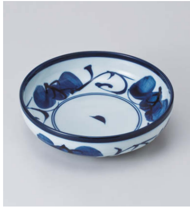
279-102-333 2,900円 濃ツタ6.8浅口ボール (20.5×6)