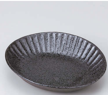
278-203-513 3,150円 ソギいぶし黒楕円鉢 (大) (23×21.1×4.6)