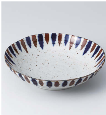
283-201-353 930円 剃十草 六兵6.8深皿 (21×5.2)