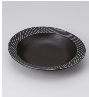
279-203-613 2,300円 タークカレー皿 灰マット黒 (22.7×21×4.5)