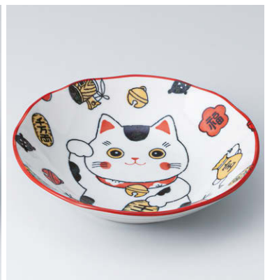
286-304-013 770円 縁起猫 8吋クーブ 赤 (20.6×5)