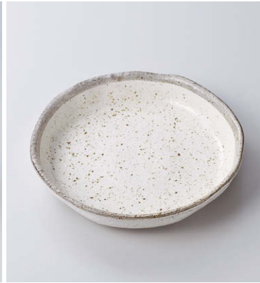
279-104-353 2,150円 白唐津7.5浅鉢 (21.5×4)