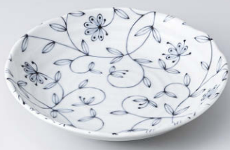
280-402-523 1,300円 夢の花カレー皿 (21.8×4)