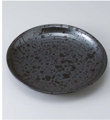
281-103-163 1,350円 油滴天目7.0皿 (23×3.5)