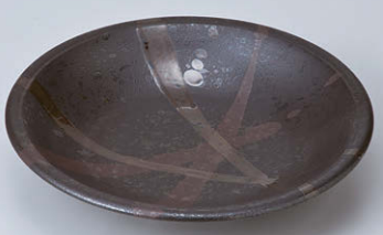
280-304-633 1,250円 東雲(黒) 7.5深皿 (23×4.4)