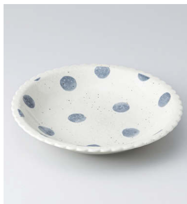
285-403-313 1,100円 あわあわ 21cm深プレート(21×3.6)