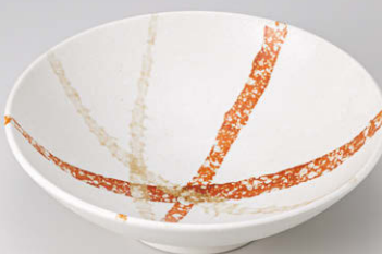
284-402-633 1,850円 東雲(白)8寸盛鉢 (24.3×8)