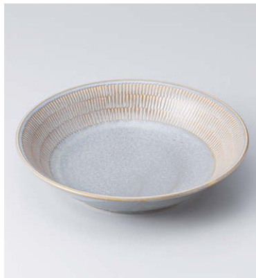
281-302-313 1,000円 窯変グレートチリ 21cm深プレート (21.5×4.5)