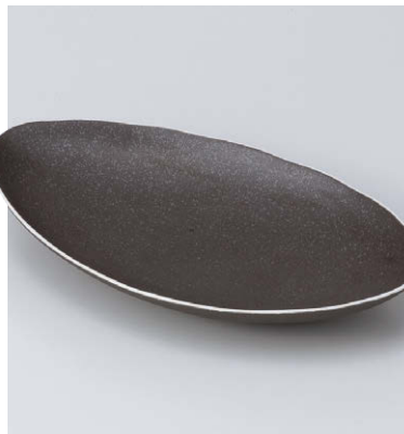
207-202-263 1,650円 黒釉オーバル皿(27.7×15.7×4.5)