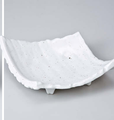
206-302-783 2,400円 白釉四つ足変型盛皿 (26.8×17.5×7)