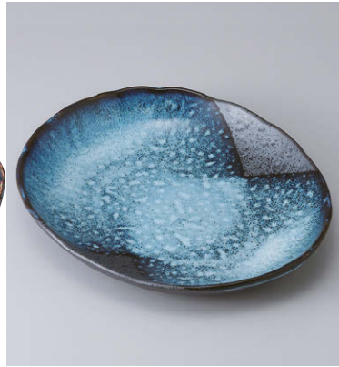
207-102-163 2,000円 清流盛込中皿(25×21×3.8)