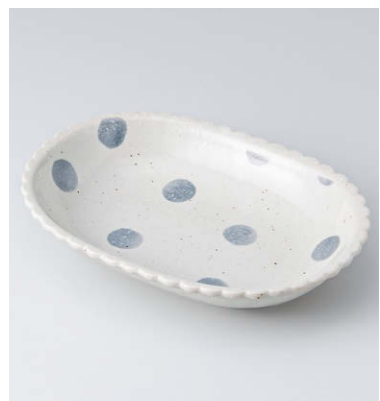
207-401-313 2,000円 あわあわ 23cm楕円鉢(22.8×17×4.3)