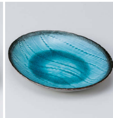
206-403-013 1,360円 均窯スカイ縄目楕円皿 (24×19.5×2.5)