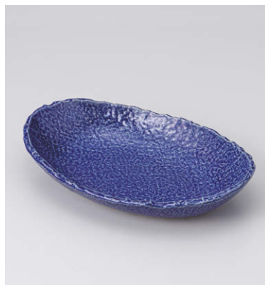
207-302-783 2,000円 ルリ 6.5楕円ボール(20.5×13.7×3.7)