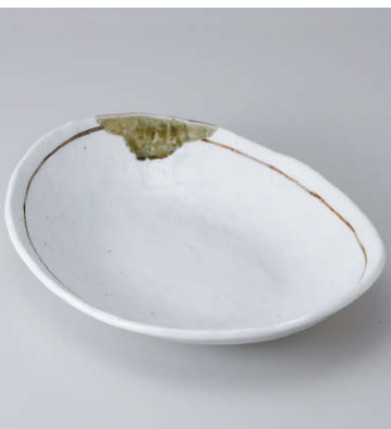
206-201-793 2,340円 志野茶ライン小判鉢(大) (25×19.3×5.8) 206-202-793 1,740円 志野茶ライン小判鉢(小) (21.8×16.4×5)