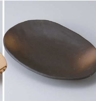
206-103-253 3,840円 備前マルチプレート(大) (27.2×18.1×3.4)