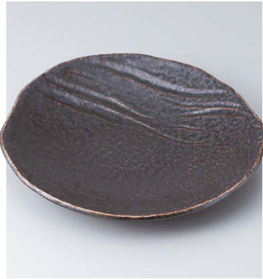
207-101-253 3,080円 28cm丸皿いぶし銀結晶(28×27.1×3.7)