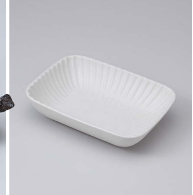
206-304-153 1,600円 白しのぎ長角深鉢 (19.6×15.5×4.5)