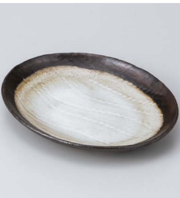
206-401-153 1,800円 縄目楕円皿 窯変金彩 (24×19.5×2.5)