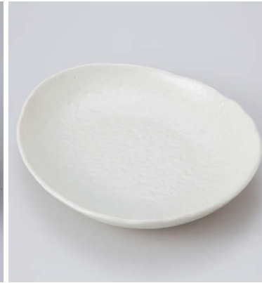
207-103-163 2,100円 粉引たたきダ円中皿(25.2×21.2×3.7)