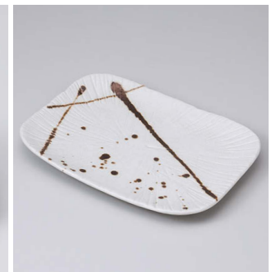
206-206-353 2,700円 金色流し盛皿 (25.8×19.8×3)