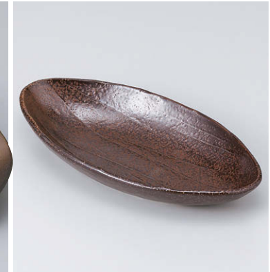
206-104-633 1,800円 茶南蛮24.5cm舟型鉢 (24.5×13×3.8)