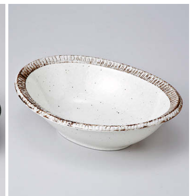
207-404-353 1,900円 刷錆粉引楕円鉢(22.5×17×6.5)