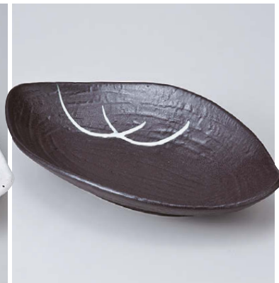
207-204-613 1,900円 黒一珍木の葉盛鉢(28.3×17.6×5)