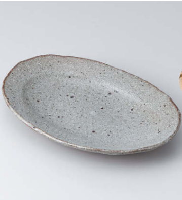
206-101-083 4,200円 砂唐津25cm楕円皿 (25.2×16.8×3.8)

刺身 向付 中鉢 小鉢 小付 珍味 松花堂 前菜皿 付皿 焼物皿 天皿 香水 蓋物 蒸碗 土瓶蒸し 小皿 和皿 多用皿 多用鉢 盛込鉢 盛込皿 酒器 フリー カップ そば用品 薬味皿 めん皿 井 多用井 波佐見焼 特選 茶漬碗 飯碗 土瓶 ポット 急須 湯呑 千茶 カスター 卓上小物 箸置 レンゲ スプーン 灰皿