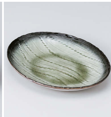
206-402-013 1,360円 均窯グリーン縄目楕円皿 (24×19.5×2.5)