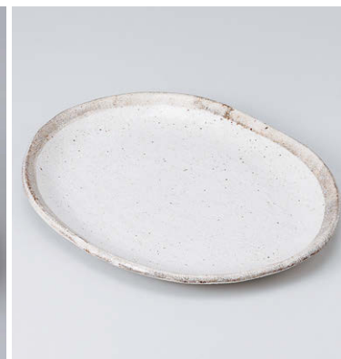
206-203-253 2,800円 白唐津小判皿大 (26.2×22.2×2.5) 206-204-253 1,800円 白唐津小判皿中 (21.5×17.5×1.7)