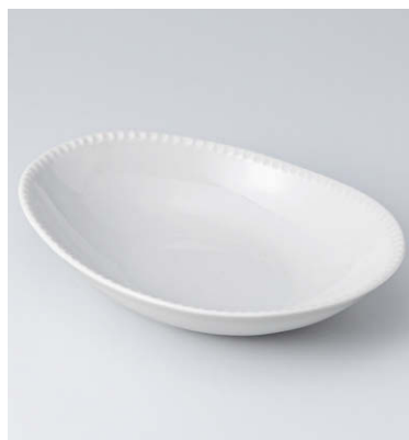
207-402-563 1,600円 フリルカレー鉢 白(23.2×17×5.3)