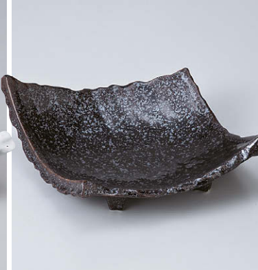
206-303-783 2,400円 黒釉四つ足変型盛皿 (26.8×17.5×7)