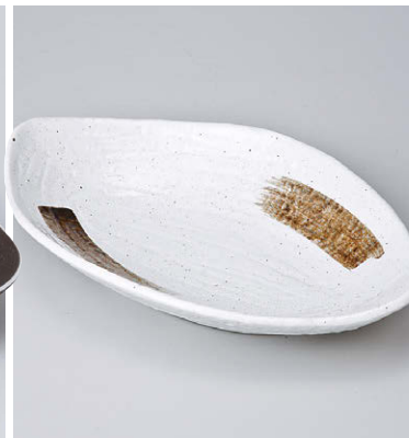
207-203-613 1,900円 白茶ハケ木の葉盛鉢(28.3×17.6×5)