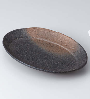
206-301-063 2,000円 黒備前23cm長丸皿 (23.3×15.2×2.8)