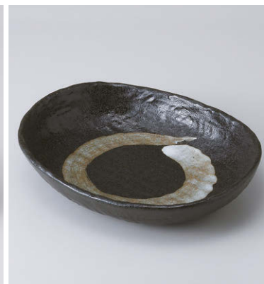
207-303-403 1,550円 うず潮盛鉢(大)(22.3×17.5×5)