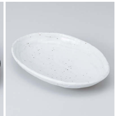
206-404-253 1,950円 錆ウズ22cm楕円皿 (22×16.5×4)