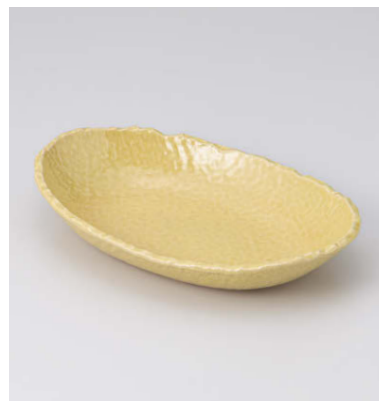
207-301-783 2,000円 アイボリー 6.5楕円ボール(20.5×13.7×3.7)