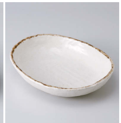
207-304-403 1,550円 吉野盛鉢(大)(22.3×17.5×5)