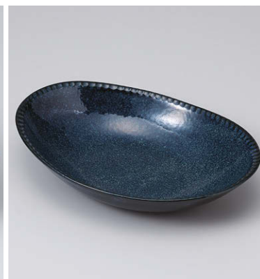
207-403-543 1,600円 窯変フリル楕円鉢(23.5×17×5.2)