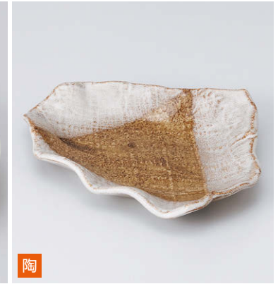
207-104-253 2,160円 黄河三方掛けタタ皿(22×17×3.7)