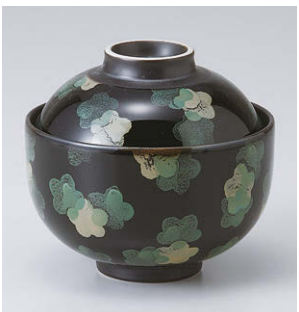
161-403-603 2,570円 花紋ちらし円菓子碗 (10.8×10)