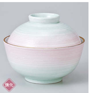
161-104-053 5,200円 白刷毛目二色吹煮物碗 (11.2×9)