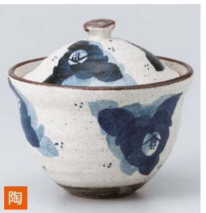
161-205-333 3,400円 呉須椿 煮物碗 (11.7×11.3)