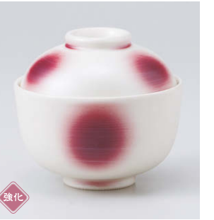
160-105-353 5,300円 マロン吹銀彩円菓子碗 (11.1×9.3)