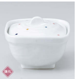
161-404-743 2,700円 彩り水玉角煮物碗 (10×10×7.5)