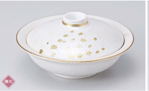
160-302-783 5,400円 金吹雪蓋向 (15×7.5)