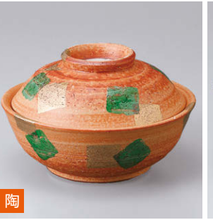
160-204-253 6,300円 金緑彩蓋向 (13.3×8.3)