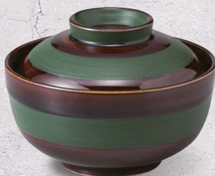
159-202-263 7,000円 obi 円菓子 (12×8.7)