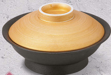
159-403-743 7,200円 赤絵万暦蓋向 (16×10)