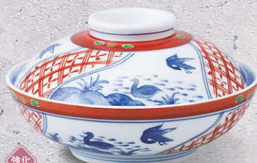
159-301-263 6,800円 錦宝来円菓子碗 (11.8×7.7)