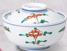
159-203-253 5,880円 金緑彩円菓子碗 (11×8.5)