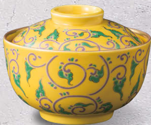
159-201-053 8,500円 黄釉色絵唐草煮物碗 (12×9)