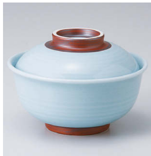
161-502-603 2,320円 青磁 反り型円菓子碗 (12.8×9)