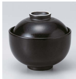
161-401-263 2,650円 漆黒円菓子 (10.1×8.8)