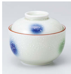
161-201-513 4,600円 三色吹 小煮物碗 (9.8×8.2)