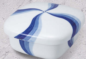
158-203-253 4,000円 流水角蓋物(12.5×12.5×8.5)