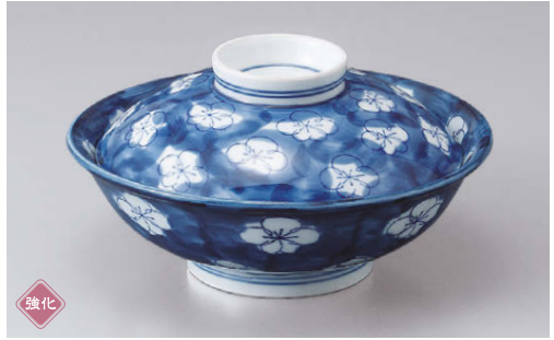
160-401-743 4,250円 梅づくし蓋向 (16.8×8.5)