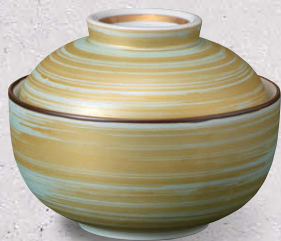
159-101-513 5,400円 緑巻金彩刷毛 小煮物碗 (9.8×8.2)