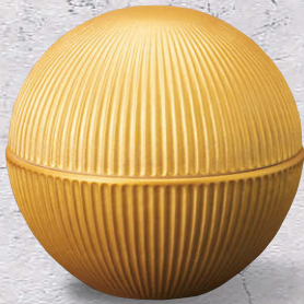
158-101-053 6,800円 ゴールドしのぎ丸蓋物(9.7×9)