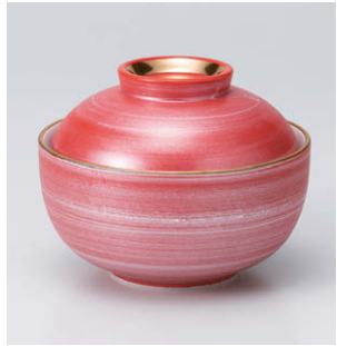
160-101-513 5,000円 赤釉銀彩刷毛 煮物碗 (11.4×8.7)

刺身 向付 中鉢 小鉢 小付 珍珠 松花堂 前菜皿 付出皿 焼物皿 天皿 香水 蓋物 蒸碗 土瓶蒸し 小皿 和皿 多用皿 多用鉢 盛込鉢 盛込皿 酒器 フリー カップ そば用品 薬味皿 めん皿 井 多用井 波佐見焼 特選 茶漬碗 飯碗 土瓶 ポット 急須 湯呑 千茶 カスター 卓上小物 箸置 レンゲ スプーン 灰皿