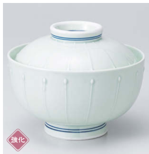
161-302-783 3,200円 ヒワ磁一珍十草 円菓子碗 (12.3×10.5)