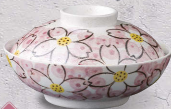
159-303-703 5,920円 ラスター赤絵花蓋向 (14.4×8)