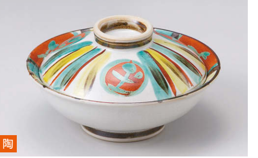
160-504-303 5,500円 十草赤丸紋平蓋向 (16.2×8.5)