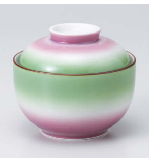
161-105-513 4,600円 二色吹 小煮物碗 (9.8×8.2)