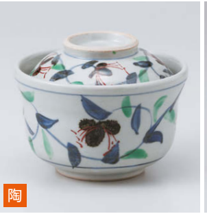
160-203-253 4,320円 唐草円菓子碗 (12.8×9)