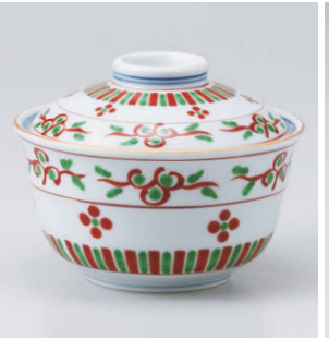
160-103-053 5,200円 総紋小花煮物碗 (11.8×8.5)