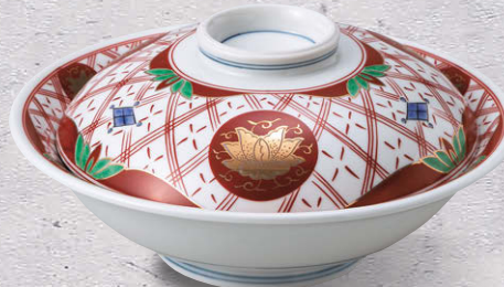
159-503-053 12,000円 華陽紋7.0骨むし (21.5×10)