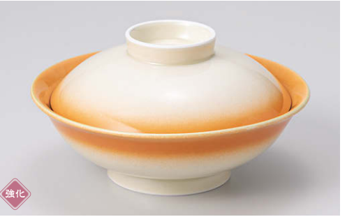
160-403-703 3,970円 黄彩平蓋向 (16.7×9)