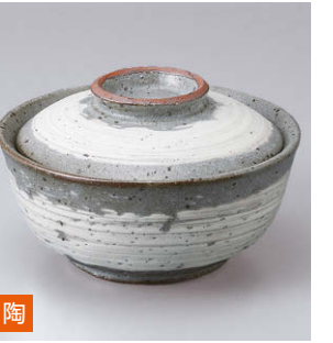
160-205-253 4,320円 粉引刷毛煮物碗 (13.3×6.2)