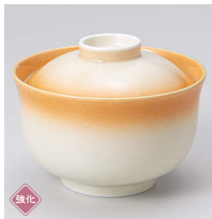
161-202-783 3,970円 黄彩円菓子碗 (12.2×9.4)