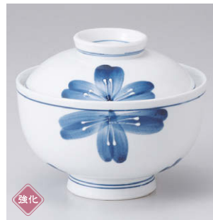
161-501-703 2,650円 一珍青花円菓子碗 (12.3×10)