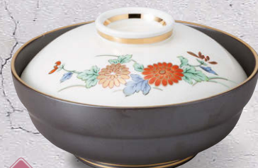
159-401-703 5,500円 ラスター華々蓋向 (13.5×7)