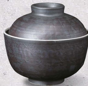
159-103-513 4,650円 いぶし銀巻 円菓子碗 (11.1×9.3)