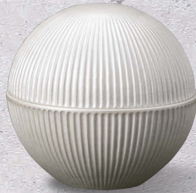
158-102-053 6,800円 シルバーしのぎ丸蓋物(9.7×9)