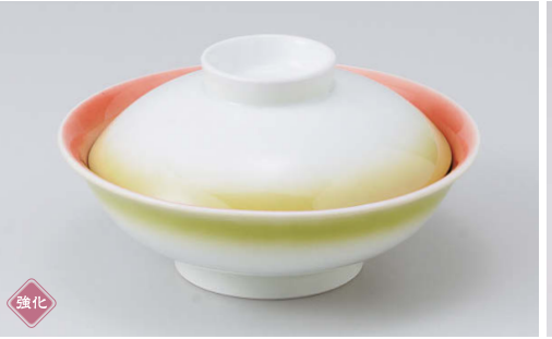
160-402-263 4,150円 二色吹き蓋向 (16.5×8.8)