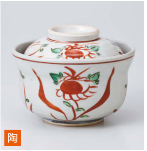
160-202-253 4,680円 赤絵花鳥円菓子碗 (12.8×9)