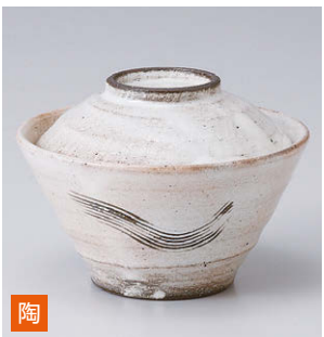
161-303-743 2,800円 粉引おたのしみ蓋物 (10×7.2)