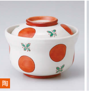
160-104-513 4,000円 赤絵丸紋円菓子碗 (11.6×9)