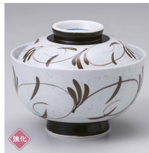
161-301-703 2,950円 梨地唐草円菓子碗 (12.3×10.5)