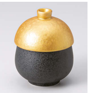
161-204-253 3,900円 シルクゴールド鈴型蓋物 (6.2×9.5-140cc)