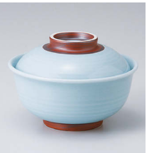
161-504-603 2,080円 青磁 反り型小円菓子碗 (10.7×8)