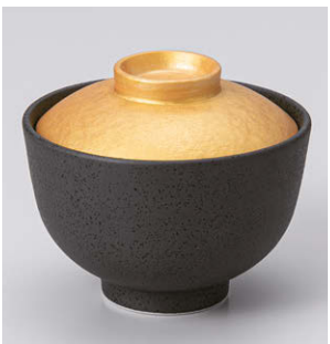
161-203-253 3,900円 シルクゴールド小蓋物 (8.7×7.5-140cc)