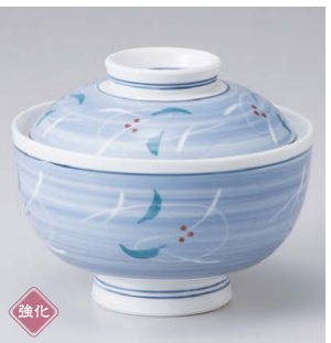
161-304-703 2,870円 彫唐草円菓子碗 (12.3×10)