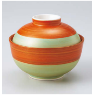
160-201-303 4,700円 曙小煮物碗 (11.6×9)