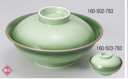
160-502-783 4,300円 緑彩平蓋向 (16.7×9) 160-503-783 4,300円 緑彩蓋向(丸) (15×9)