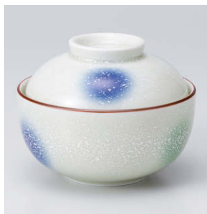
161-102-513 4,800円 三色吹 煮物碗 (11.4×8.7)