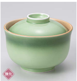
161-103-743 3,970円 緑彩円菓子碗 (12.2×9.4)