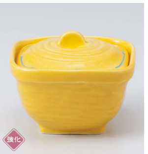
161-405-703 2,700円 黄輝角煮物碗 (10×10×7.5)