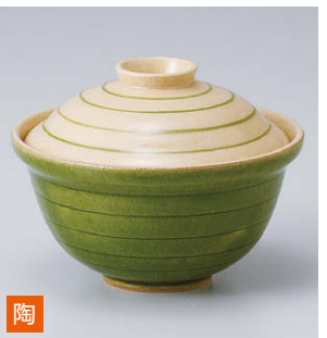
161-305-743 2,700円 グリーン渦福碗 (10.8×8.5)