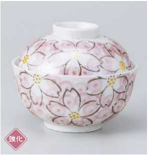
160-102-783 5,500円 ラスター華々煮物碗 (11.5×9.5)