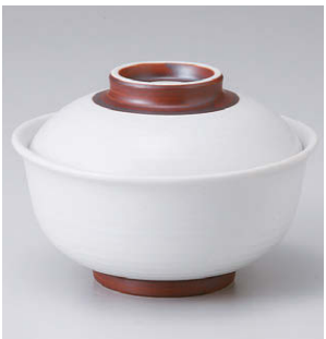
161-503-603 2,320円 白化粧 反り型円菓子碗 (12.8×9)