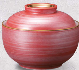
159-102-513 4,800円 赤釉銀彩刷毛 小煮物碗 (9.8×8.2)