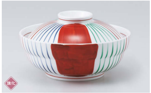
160-301-703 5,430円 赤間取十草蓋向 (14.4×8.3)