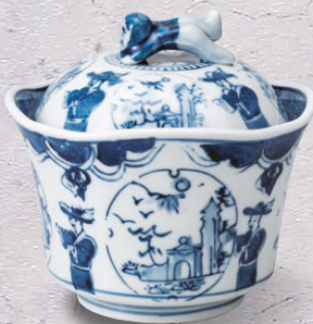
158-201-053 4,900円 古染閑人蓋物(10.5×10.5×10.5)