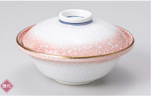
160-303-743 5,350円 ピンク吹蓋向 (15.3×8)