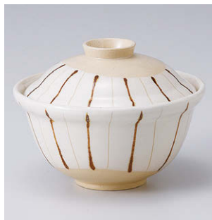
161-402-703 2,690円 錆十草福碗 (10.8×8.5)