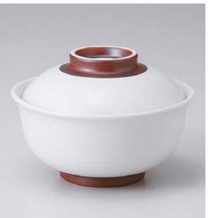
161-505-603 2,080円 白化粧 反り型小円菓子碗 (10.7×8)