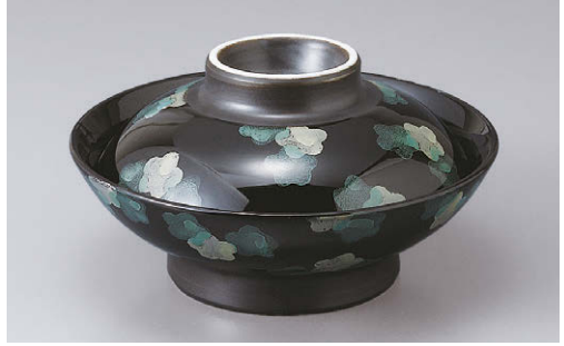
160-501-603 3,110円 花紋ちらし蓋向 (16.5×9)