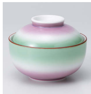
161-101-513 4,800円 二色吹 煮物碗 (11.4×8.7)